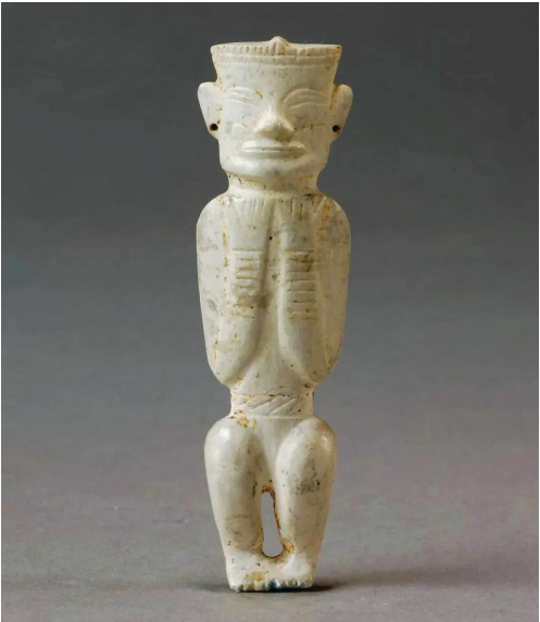
凌家滩玉人,身上的孔径仅有头发丝那么细。

古人为了解决玉器的钻孔问题,发明了钻孔工具榧钻和管钻。榧钻是用一根带尖头的实心榧棒直接在玉上加水添砂钻,材料有硬木、长条石核或者动物骨角等;管钻是用竹、骨等管状物在打孔处来回旋转,同时不断向槽内加水添砂,用管带动