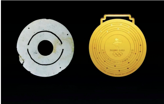
凌家滩玉璧。 2022年北京冬奥会奖牌。