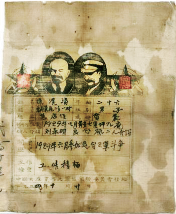
独臂将军陈波血染的党证。