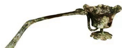
洛阳龙门博物馆藏北魏鹊尾香炉。

此外,还有一种炉身为莲花形的鹊尾香炉,河北下八里辽墓壁画和《南诏图传》中都有鹊尾炉的画面,山西朔州金代崇福寺弥陀殿壁画中的胁侍菩萨及山西右玉明代宝宁寺水陆画中的大梵天,也都手持这样的莲花形鹊尾香炉。美国奈尔训美术馆收藏有一件实物,2016年保利拍卖过一件唐代铜鎏金莲花形唐草纹行炉,这些均应