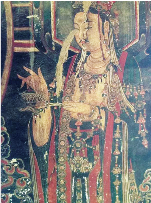
山西朔州崇福寺金代壁画中菩萨手持莲花形鹊尾香炉。