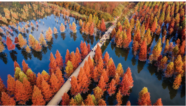
12月10日拍摄的甸尾村水杉湿地一景（无人机照片）。冬日，云南省昆明市盘龙区滇源街道甸尾村水杉湿地的水杉林色彩艳丽，景色如画。这片水杉湿地位于滇池上游、昆明松华坝水源保护区内。

据新华社北京12月10日电（任沁沁、朱家莹）记者从公安部获悉，10日起全国全面推行驾驶证电子化，目前各地公安交管部门已通过全国统一的“交管12123”App为6300多万名群众核发电子驾驶证。10日当天，共为390多万名群众核发电子驾驶证。 电子驾驶证在全国范围内有效，为驾驶人以及相关行 业、管理部门提供“亮证”“亮码”服务，在客货运输、汽车租赁、保险购置等领域广泛应用。领取电子驾驶只需三步：下载“交管12123”App、注册用户、线上申领。驾驶证电子化作为法定证件智能化、数据融合实战化、服务管理便捷化的成功实践，进一步满足信息化时代群众“掌上办事”新需求，确保了公安电子证照权威性、公信力；电子驾驶证可在办理交管业务、接受执法检查时出示，提升了证件使用便捷度，提升了交管部门执法服务效能。