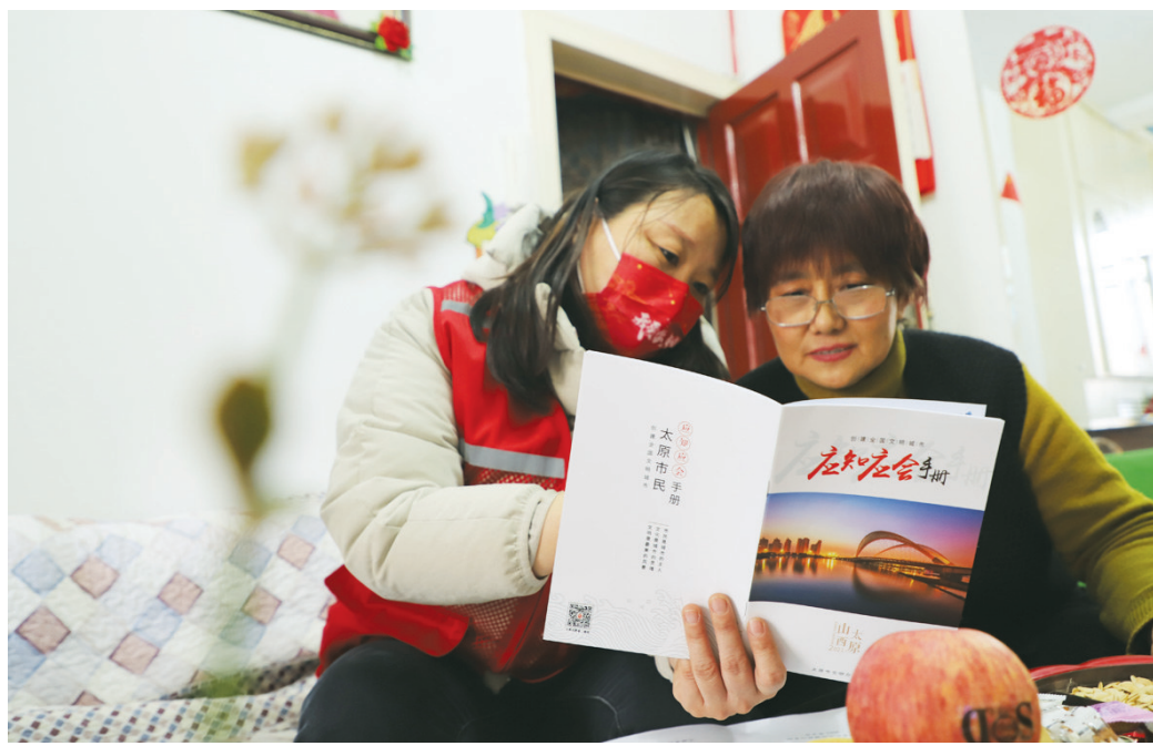
12月15日,老军营二社区开展“创建文明城市市户宣传”活动。

用好时势是根本。“审度时宜,虑定而动,天下无不可为之事。”躬逢伟大新时代,抢抓历史新机遇,考验着我们的智慧和勇气。