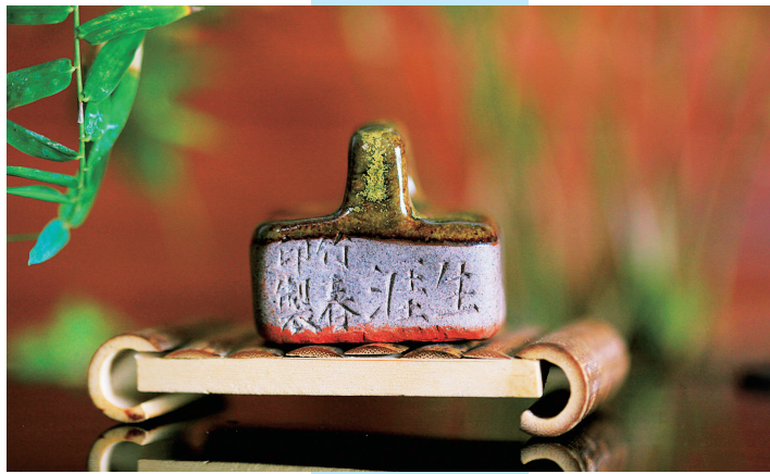
黑红釉·乌金山陶泥印