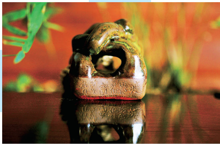
茶叶沫釉·乌金山陶泥印