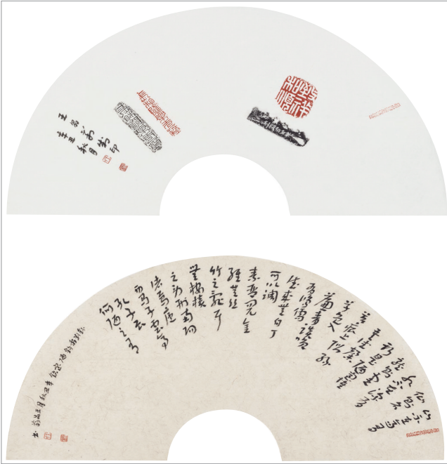
《致祥和顺 长相随乐无极》