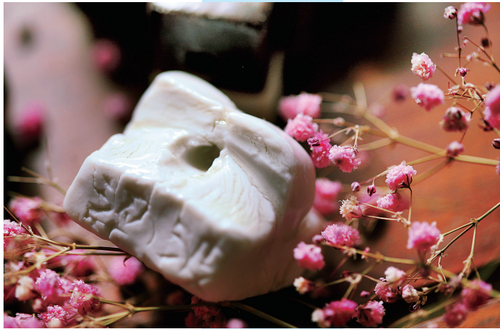
黑红釉·乌金山陶泥印