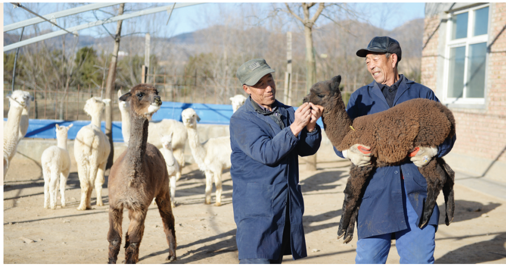
▶ 工作人员检查羊驼。

提起呆萌可爱的羊驼，人们很难将它与千沟万壑的黄土高原联系起来。在我市阳曲县坪里村，这种原产于南美洲的动物不仅“站稳了脚跟”，还带动了上下游产业链发展。短短7年时间，依托羊驼养殖，村里的基础设施完善了，村民的腰包也更鼓了。