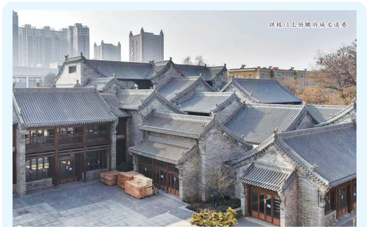
拱极门上俯瞰府城文道巷