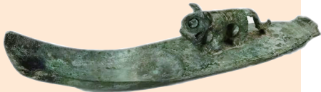
虎饰匕形器(商,山西博物院藏)