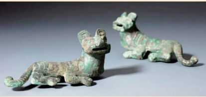
虎形铜饰(西周,山西考古博物馆藏)