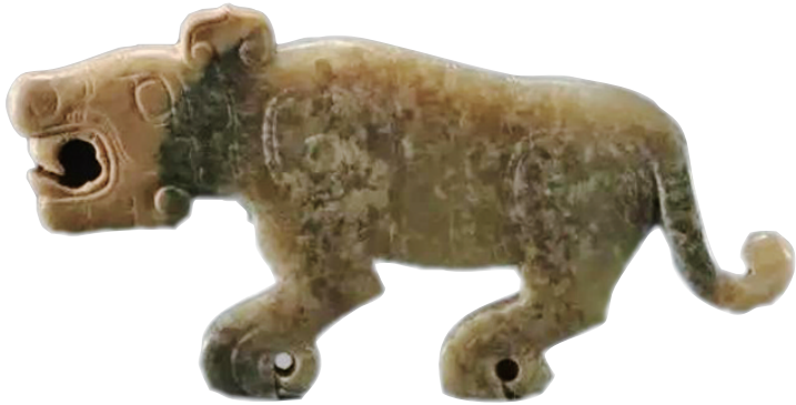
虎形玉佩(西周,山西博物院藏)