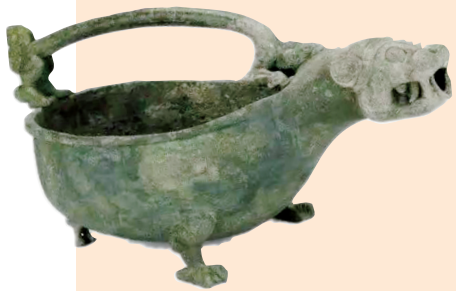
赵卿墓虎头匜(春秋,山西青铜博物馆藏)