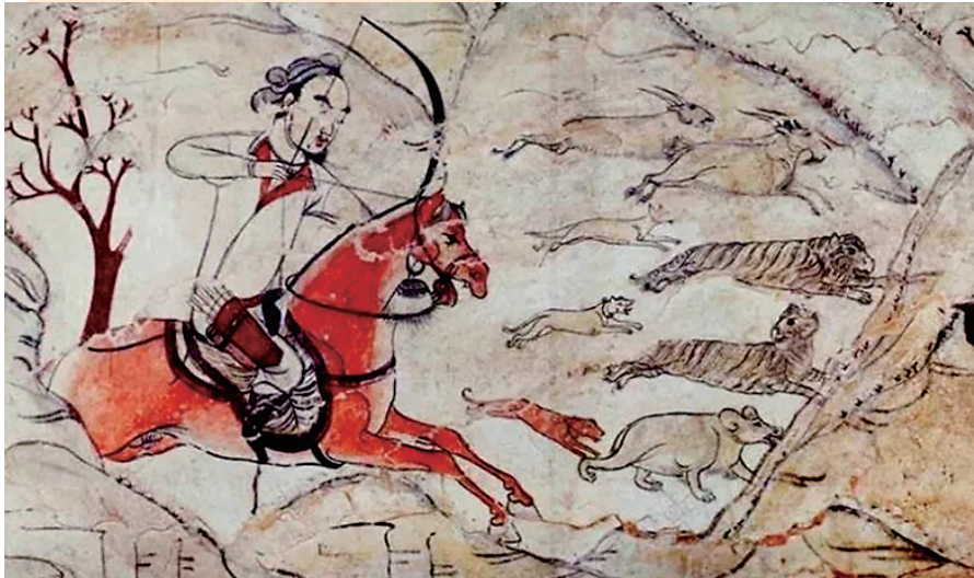
忻州九原岗壁画《狩猎图》局部(北朝,山西博物院藏)