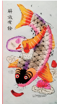
年画《解放有余》《胜利有余》(天津博物馆藏)