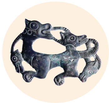
虎羊头铜牌件(西汉,大同市博物馆藏)