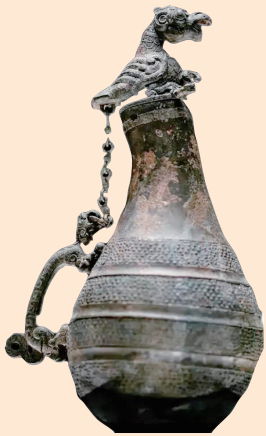
匏壶(春秋,腹上有一虎形釜,山西青铜博物馆藏)