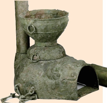
虎形灶(春秋,山西青铜博物馆藏)