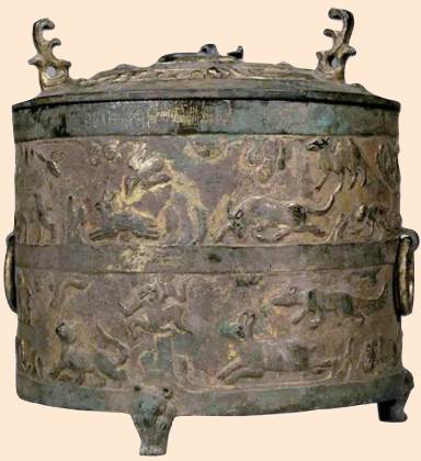
胡傅温酒樽(汉,腹部饰有虎、羊、骆驼、牛、猴和龙、凤等神异动物十多种,山西博物院藏)