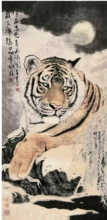
作者高奇峰(1889~1933),晚清画家,曾留学日本,岭南画派创始人之一。