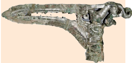
虎鹰互搏釜内戈(春秋,山西青铜博物馆藏)