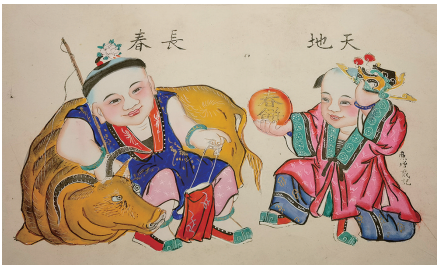
婴戏题材年画《天地长春》(天津博物馆藏)

过年贴一张年画,图的是喜庆吉利,蕴含的是祈福祝愿。“杨柳青青话年画”木版年画展正在山西博物院展出,一幅幅色彩斑斓的年画,生动展示了中国的年文化,也勾画出世世代代朴素而真挚的生活愿望。