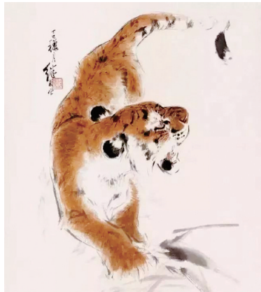
作者刘继卣(1918~1983),新中国连环画奠基人,中国近现代美术史上早有成就的动物画、人物画一代宗师。