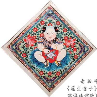
老版斗方《莲生贵子》(天津博物馆藏)