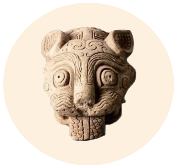
虎头陶模(春秋,山西考古博物馆藏)