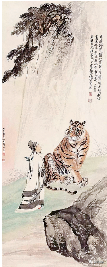
作者张善孖(1882~1940),现代画虎大师,号虎痴。张大千的二哥,擅长画虎,人称“虎公”。