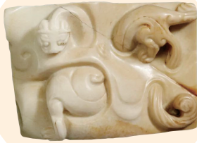
玉螭虎玉剑(汉,山西博物院藏)