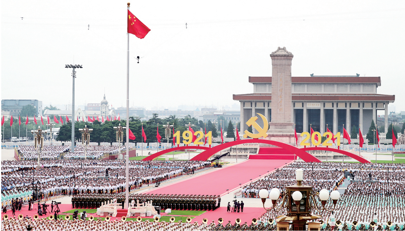
2021年7月1日上午,庆祝中国共产党成立100周年大会在北京天安门广场隆重举行。

办好中国的事情,关键在党。中国特色社会主义制度具有多方面显著优势,其中中国共产党领导是最大优势,是其他方面优势得以存在和发挥作用的根本保证。