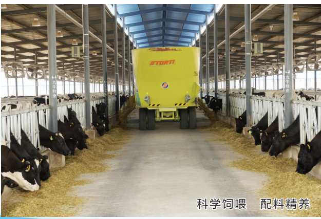
科学饲喂 配料精养