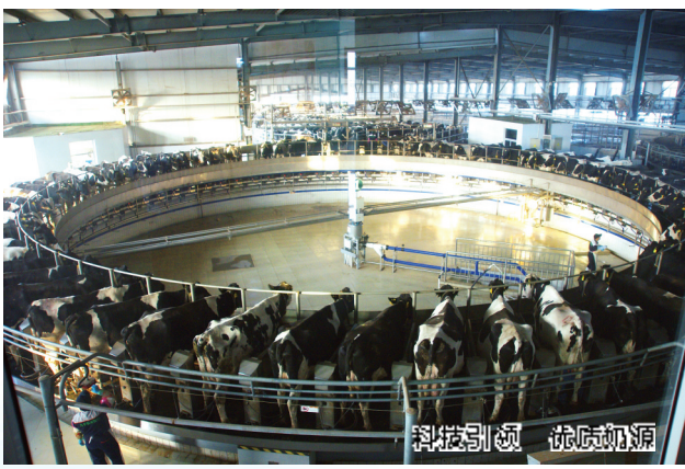
科技引领 优质奶源