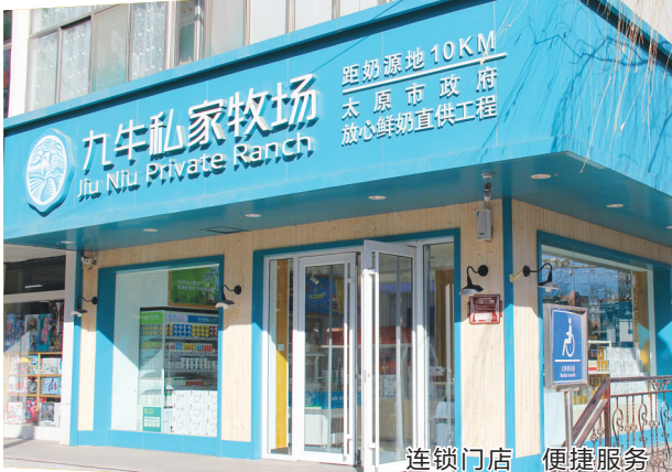
连锁门店 便捷服务