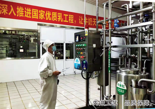
先进工艺 品质保障