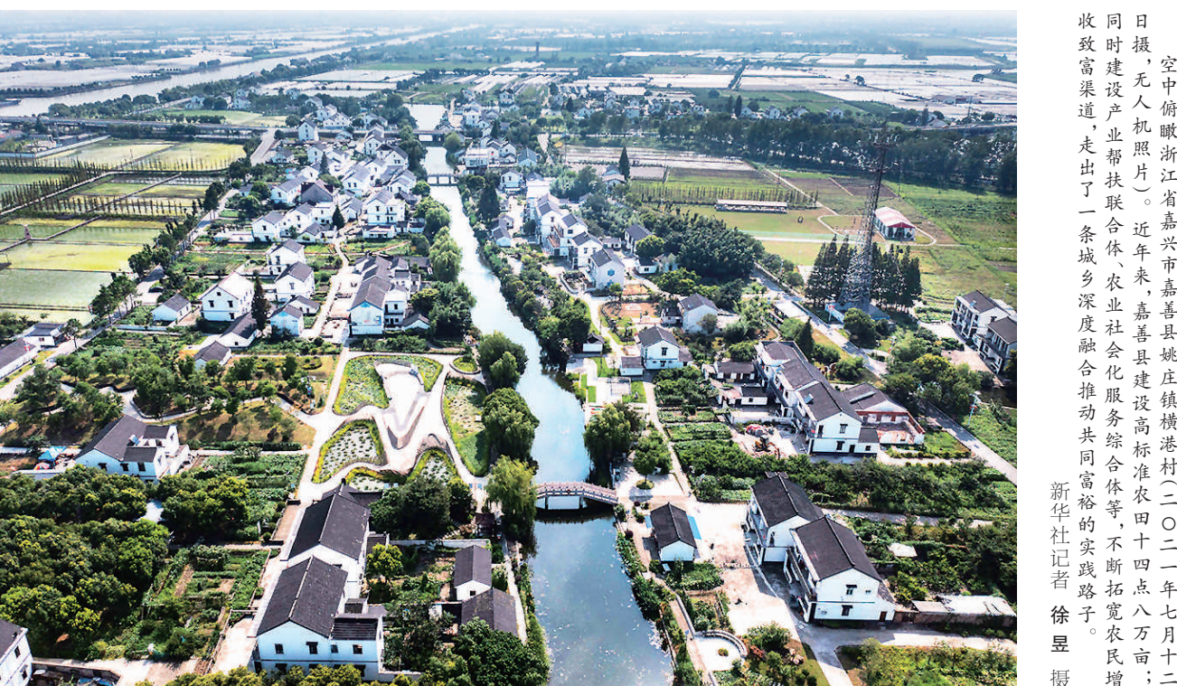
空中俯瞰浙江省嘉兴市嘉善县姚庄镇横港村（二〇二一年七月十二日摄，无人机照片）。近年来，嘉善县建设高标准农田四十二万亩；同时建设产业帮扶联合体、农业社会化服务综合体等，不断拓宽农民增收致富渠道，走出了一条城乡深度融合推动共同富裕的实践路子。