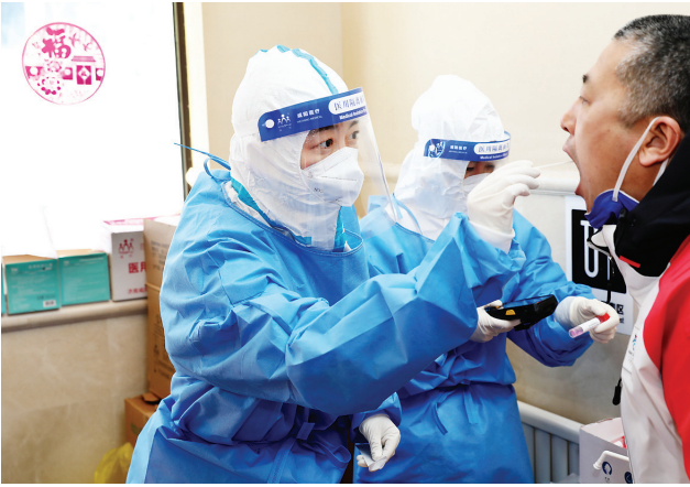
医务工作者在北京2022年冬奥会张家口赛区云顶场馆群住宿区开展核酸检测工作(2022年2月1日摄)。

再回首,历史因我们而骄傲!再出发,我们一起向未来!新华社记者 林德韧 王沁鸥 岳冉冉 孔祥鑫(据新华社北京3月13日电)