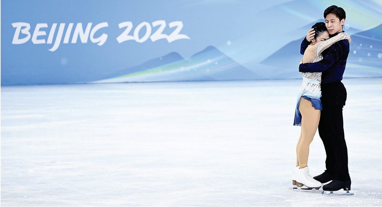
中国选手隋文静(左)/韩聪在北京二〇二二年冬奥会花样滑冰双人滑比赛中(二〇二二年二月十九日摄)。

“没有路又怎样?创造一条路就好了!”这是北京冬奥会中国花样滑冰双人滑组合隋文静/韩聪在夺金后的感慨。历经年轻时的不被看好、状态正盛时的接连伤病,两人坚持牵手十五载,终于在北京的冰面上圆梦摘金。赛后,隋文静坦言,两人曾一度感到“已经没有路了”。但北京冬奥会的赛场,他们挑战超高难度的“捻转四周”成功,突破极限,涅槃重生。