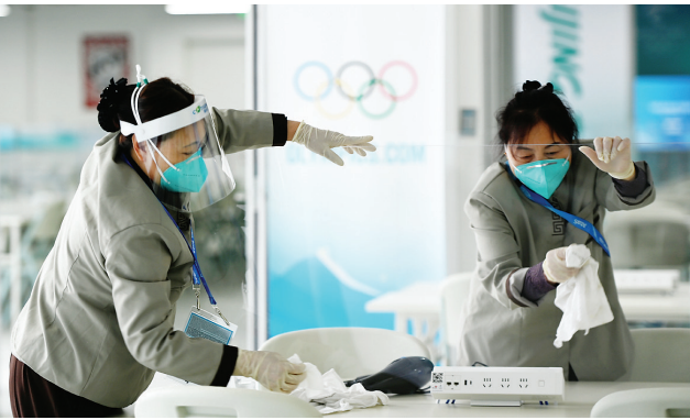
工作人员在北京国家速滑馆“冰丝带”的媒体工作区域消毒(2022年1月28日摄)。