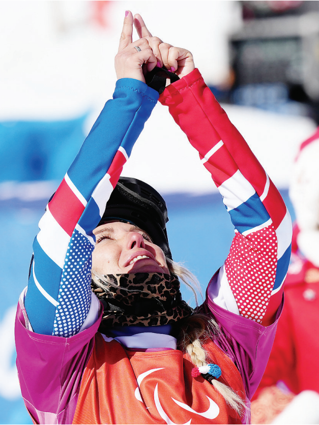
法国选手塞蒂尔·埃尔南德斯在北京2022年冬残奥会残奥单板滑雪女子障碍追逐赛后庆祝(2022年3月7日摄)。

3月4日,北京冬残奥会开幕式,视障运动员李端摸索了一分钟后,终于在全场观众的加油声中将主火炬稳稳插入了卡槽,国家体育场“鸟巢”中的“大雪花”再次被点亮。