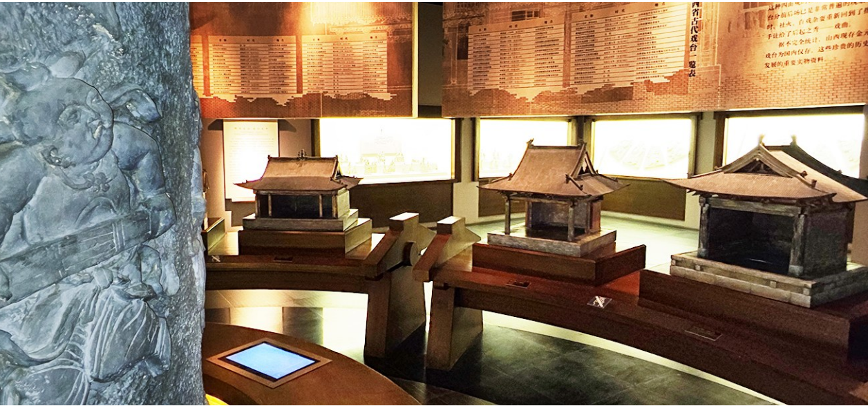
山西历代古戏台模型