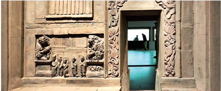
墓葬中的杂剧形象砖雕(金)