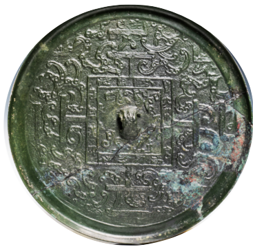
“大乐贵富”博局纹镜(山西博物院藏)

博局纹镜是汉代流行时间最长的一种青铜镜。 博，是古代的一种棋艺游戏，博局就是这种棋艺游戏的棋盘，博局纹镜的名称便来自于此。 博局纹镜上装饰的棋艺游戏就是六博棋，六博的发明很早，最迟不晚于商代。春秋战国时期，六博成为人们十分喜爱的娱乐活动，当时称博戏。秦汉时期，博戏更加流行，当时的最高统治者如汉代的文帝、景帝、武帝、昭帝、宣帝都很喜爱博戏。西汉时朝廷里设有博待诏官，善博者在社会上享有较高的地位。汉代还出现了专门研究博术的人和著作。六博棋在当时也成为高士文人的一种时尚追求。 东汉以后，六博棋开始衰落，玩法逐渐失传，现存的有关史料零云散星，语焉不详。 博局纹镜的装饰图案一般用青龙、白虎、朱雀、玄武四兽，并搭配有辘齿纹、卷云纹或卷草纹等，装饰充实而有序，线条流畅优美，铸造精致。 山西博物院藏有几面博局纹镜，分别是“见日之光”草叶博局纹镜、“泰言”博局纹镜、“善铜”四神