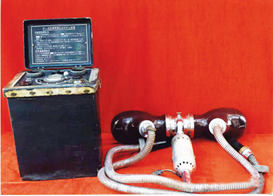
15毫安小型X光机(长治医学院附属和平医院史馆藏)