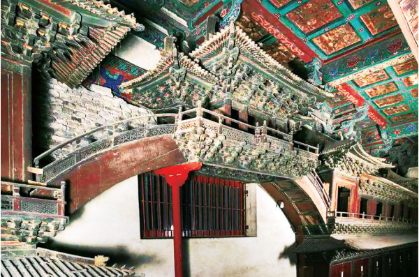
华严寺薄伽教藏殿内的辽代木作

木结构一点也不简单，光斗拱种类就用了17种，其中的柱头斗拱为双下昂七铺作，是目前已知辽代斗拱中最复杂的一种。单个斗拱只有4×3厘米大小，要做出这样复杂的斗拱组合来，难度之大可想而知。 为了通风和照明，殿后壁的明窗将两边的壁藏断开，聪明的古代工匠们充分运用了力学的原理，在其间搭建了一座圆弧