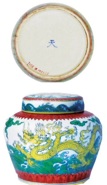
明成化斗彩海水龙纹天字盖罐，罐底写有“天”字(故宫博物院藏)

明成化瓷器造型秀气玲珑，胎质细腻，料彩纯正，色调柔和，轻盈秀雅盛行于世。其中，罐底写一个“天”字的成化“天字罐”尤为珍贵。 “天字罐”，底款为“天”字，在清档中记录为“成窑天字罐”。“天字罐”分为青花器和斗彩器两类，所绘图案纹饰主要为海水飞马、变形莲瓣纹、夔龙纹或山水纹饰等。斗彩瓷器又称为“青花填彩”“青花点彩”“青花加彩”等，系用青花于胎上勾描出纹饰构图的轮廓，然后罩以透明釉高温烧成，再在青花轮廓线内填画各种彩料，复烧低温二次烧成。而青花天字罐，口大、短颈、肩浑圆、腹略收、宽底，器有大小，高大者形如绍兴老酒坛。 “天字罐”为成化特有。清代康熙朝、雍正朝景德镇窑偶有仿品问世。 “天字罐”罐底为什么写有一个“天”字呢？ 很多典籍中说天为万物主宰；程朱理学奉天为尊；天与天子、天家、天保九如常常紧密结合体现祈禱福寿、尊崇；“天字第一号”通常含有最大的、最好的、最高的等意思。 由此可以推测，成化“天字罐”应系官窑器物，为皇权贵族所用。“天”字款显示了瓷器做工质量、使用对象等多方面的至高与尊贵。 目前收藏市场上明代官窑瓷器