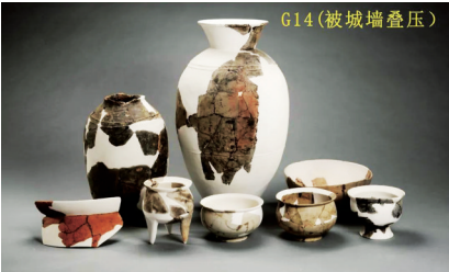
北城墙关键层位出土陶器

2021年度全国十大考古新发现日前揭晓，位于湖南省常德市澧县澧南镇鸡叫城村的鸡叫城遗址入选。该遗址的考古工作始于20世纪90年代，作为“中华文明探源工程”和“考古中国”课题实施的重点项目，2018年至2021年，湖南省文物考古研究所联合四川大学考古文博学院，对鸡叫城遗址进行连续四个年度的田野考古工作，总发掘面积1850平方米，其中2021年发掘面积800平方米。 考古工作取得以下重要收获： 第一，明晰了鸡叫城聚落群的演变过程。目前的考古工作显示，鸡叫城遗址本体彭头山文化时期即有人居住。石家河文化时期，形成了由城址本体、城外聚落遗址、外围环壕以及平行水渠和稻田片区组成的城壕聚落集群。 第二，发现屈家岭文化大型木构建筑。城址西部发掘区发现多处大型建筑台基，其上有多组不同时期的大型建筑遗迹，以屈家岭文化二期早段的F63规模最大、保存最好，绝对年代约为公元前2800—2700年。 主体建筑为开挖基槽后垫长木板以作基础，于木板一侧立柱。木板加工规整，有的木板边还可见抬板时留下的绳索。木柱极为考究，以直径约0.5米的半圆形大木柱为主体，间以长方形小木柱，并在转角处以四分之一圆木作为转承，木柱上有两侧约45°的斜穿孔。 第三，揭露出体量巨大的谷糠堆积。经勘探，早期壕沟上层有分布较广的谷糠堆积，初步推算出这些谷糠堆积所代表的稻谷重量约为2.2万公斤(带壳)。 第四，发现石家河文化时期水稻田。在历史时期水稻田下发现有一层黑色淤泥，淤泥层下为石家河文化时期