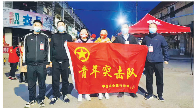
农业银行娄烦县支行青年突击队主动奔赴抗疫一线。