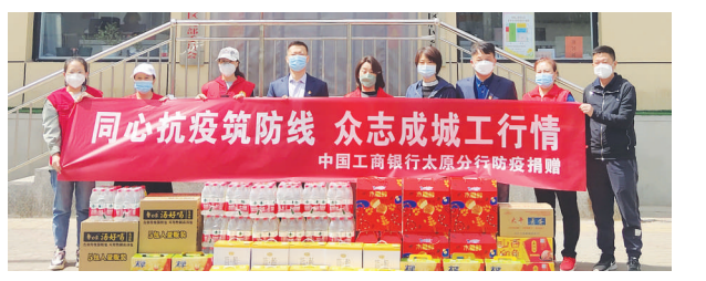
工商银行太原分行为社区捐赠抗疫物资。

工商银行太原分行积极贯彻省总行和太原市疫情防控决策部署,在做好疫情防控与金融服务保障的基础上,全行干部职工积极响应号召,踊跃参与到抗疫志愿服务一线,为我们的城市保驾护航。