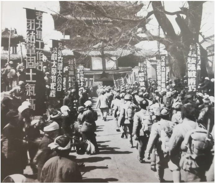
▲华北军区三大主力兵团齐聚太原前线。