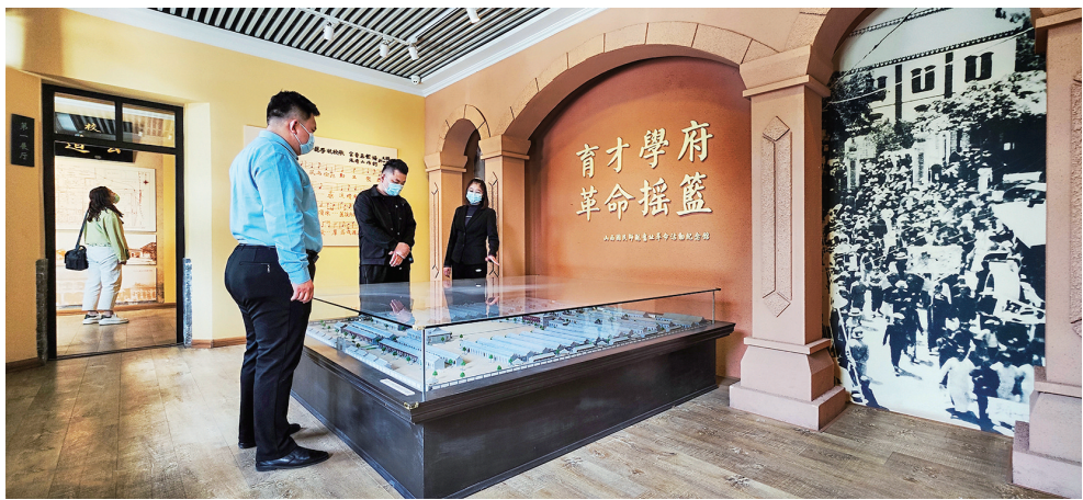
“育才学府 革命摇篮”序厅