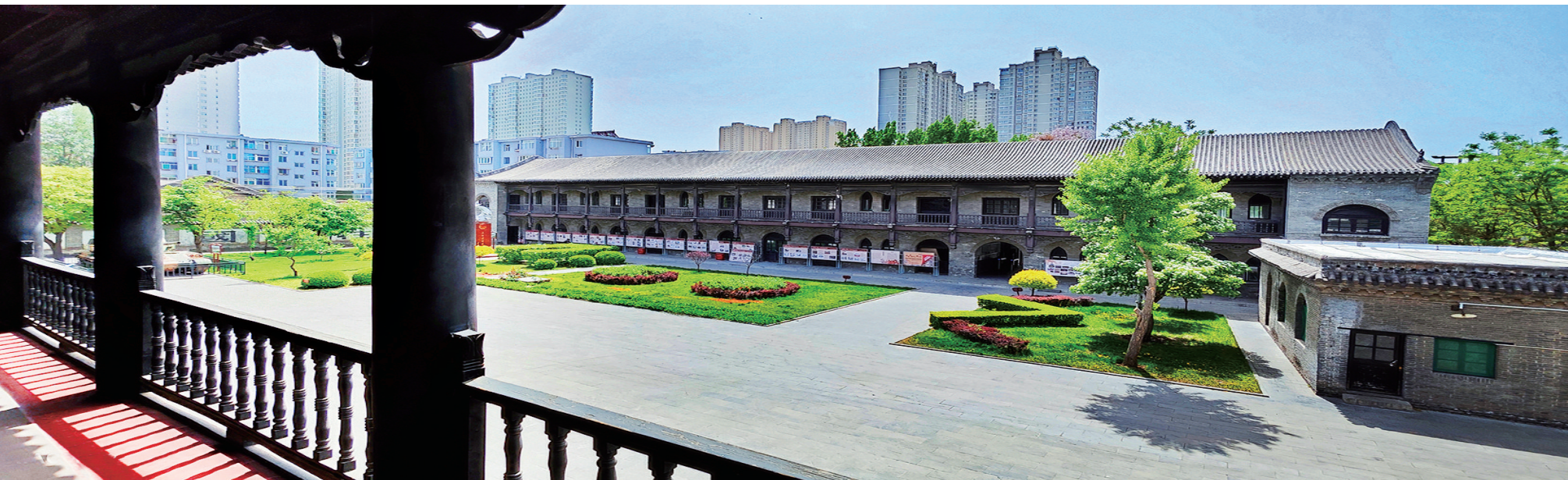
山西国师范旧址革命活动纪念馆院景