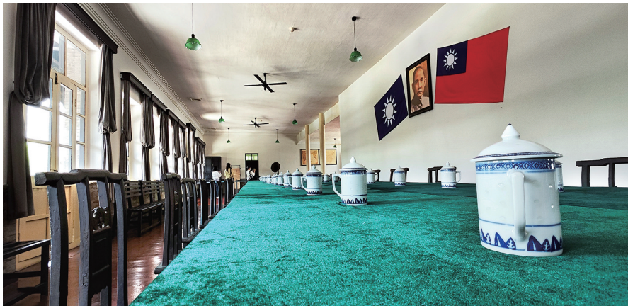
主楼旧址二楼会议室实景