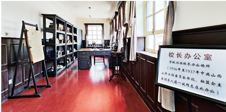
原状陈列的校长室