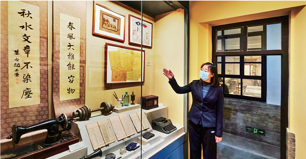
“创建国民师范 普及国民教育”展厅