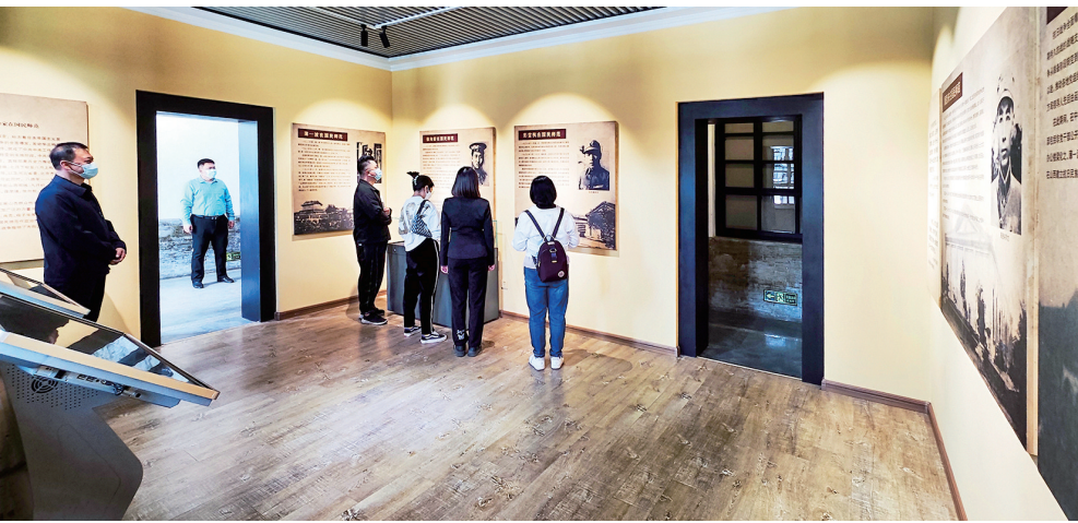
缅怀先烈功绩，铭记“红色呐喊”