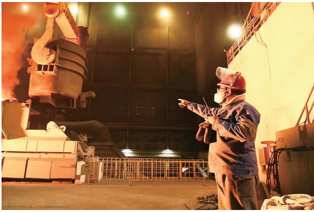
火热的电炉甲班生产车间。

成吨的钢铁原料倒入炉内,1500摄氏度高温的钢水翻滚、火花飞溅……伴随着热火朝天的工作场景,车间内炉前气温超过40摄氏度。普通人呆几分钟都会感到窒息,但山西太钢不锈钢股份有限公司炼钢一厂碳钢冶炼作业区电炉甲班不仅高质量完成工作任务,而且不断创新,优化作业流程,降低原料成本,提高生产效率,成为企业名副其实的“标兵”班组。今年,电炉甲班登上全国领奖台,被中华全国总工会授予全国工人先锋号。