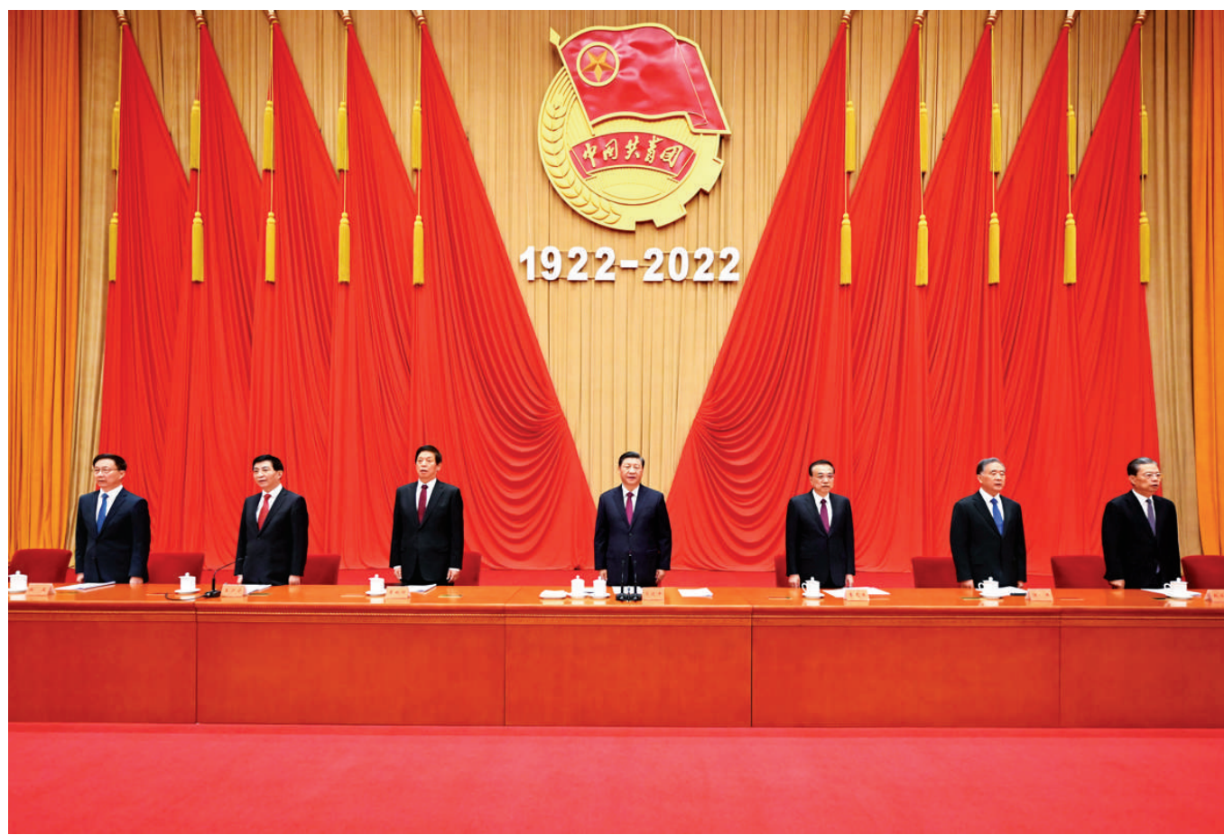
5月10日,庆祝中国共产主义青年团成立100周年大会在北京人民大会堂隆重举行。习近平、李克强、栗战书、汪洋、王沪宁、赵乐际、韩正等出席大会。

新华社北京5月10日电 庆祝中国共产主义青年团成立100周年大会10日上午在北京人民大会堂隆重举行。中共中央总书记、国家主席、中央军委主席习近平在会发表重要讲话强调,青春孕育无限希望,青年创造美好明天。新时代的中国青年,生逢其时、重任在肩,施展才干的舞台无比广阔,实现梦想的前景无比光明。实现中国梦是一场历史接力赛,当代青年要在实现民族复兴的赛道上奋勇争先。共青团要牢牢把握培养社会主义建设者和接班人的根本任务,坚持为党育人、自觉担当尽责、心系广大青年、勇于自