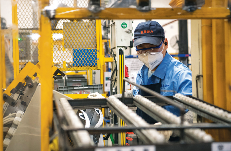
5月11日,在成都市一家汽车配件加工企业,工人正在进行焊接工作。