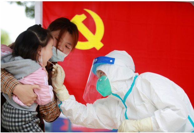
5月12日,在江苏省扬州市杉湾花园社区的一处核酸检测点,护士给小朋友进行核酸采样。