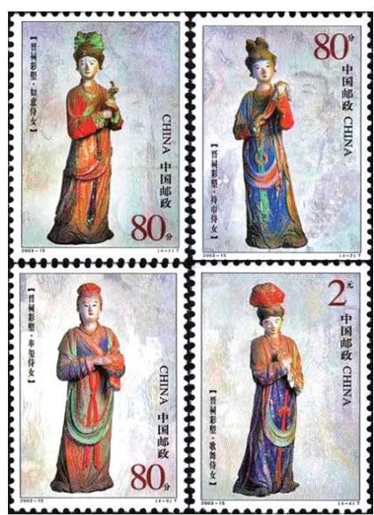
图① 如意侍女 图② 持巾侍女 图③ 奉盥侍女 图④ 歌舞侍女