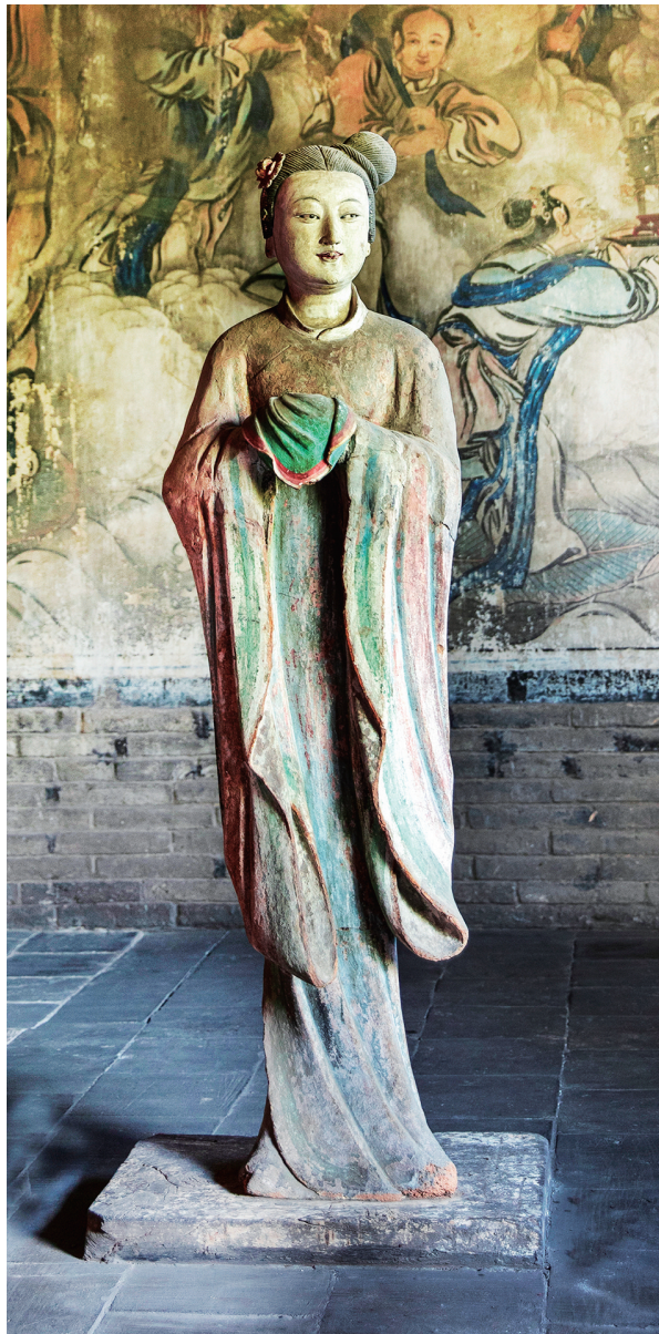
水母楼“东方美人鱼”