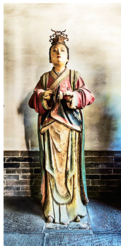
唐叔虞祠元代乐伎彩塑