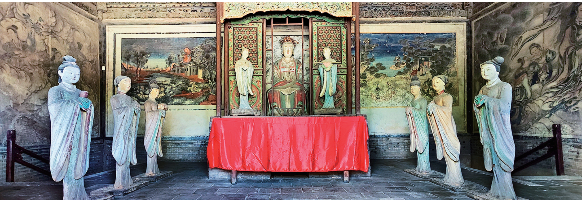
水母楼明代水母及侍女彩塑