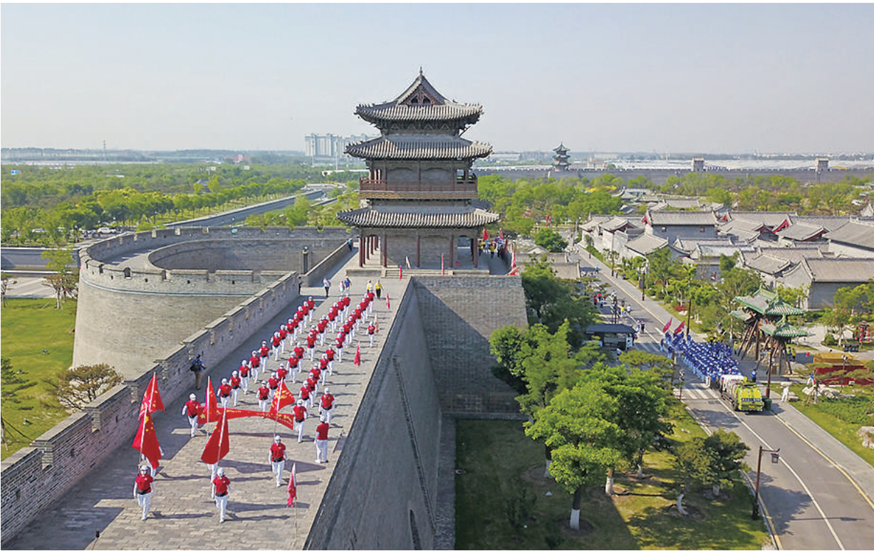
5月21日，由晋源区疾控中心和太原古县城联合举行“环城徒步走 健康伴我行”首届环城徒步大会，来自省内的2000余名徒步爱好者参加活动。

（上接第1版）对此，古交市将村（社区）网格全部嵌入综合行政执法中，不断加强县、乡、村三级书记抓网格的力度，配齐配强网格党组织书记，按照“乡村治理所有要素入网、所有事务进网”原则，整合河口镇24个网格内护林员、地质灾害监测员、计生服务员等12种类型人员，职责，做到“多员合一网”，形成协同作战的局面。网格员全天候巡查，随时发现、及时上报问题，成为发现违法行为和风险隐患的“全景探头”。 下一步，古交市将坚持党建引领，进一步整合执法力量和资源，试点先行、积累经验，通过以点带面，持续推动赋能放权，持续加强行政执法队伍建设，持续将行政执法与网格治理深度融合，进一步推动改革向纵深推进，全面提升基层治理能力，不断提升人民群众的幸福感、获得感、安全感。 记者 徐方伟 通讯员 康巧珍 张雯杰