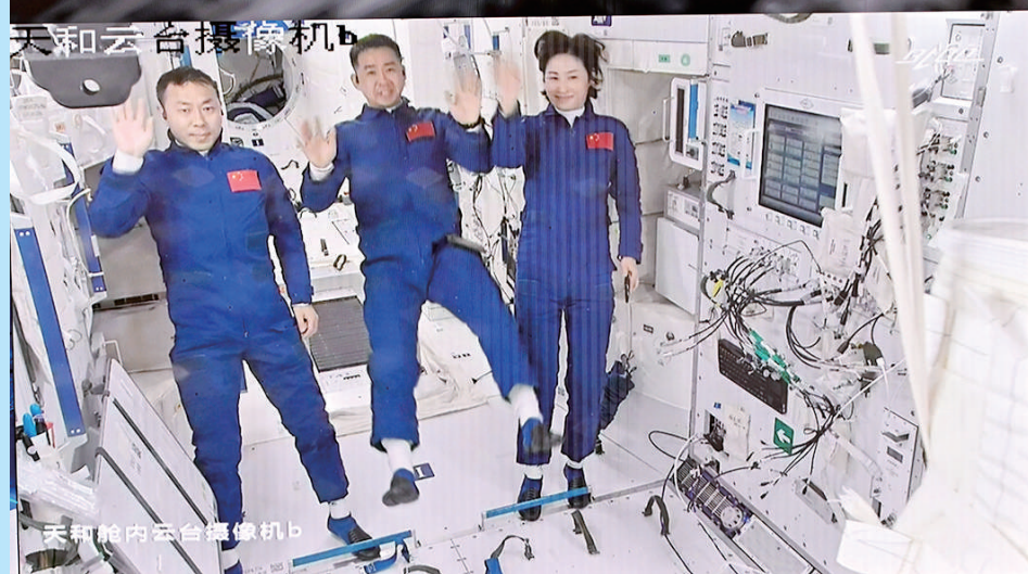
三名航天员顺利进驻天和核心舱

这是6月5日在北京航天飞行控制中心拍摄的进驻天和核心舱的航天员陈冬(中)、刘洋(右)、蔡旭哲向全国人民挥手致意的画面。