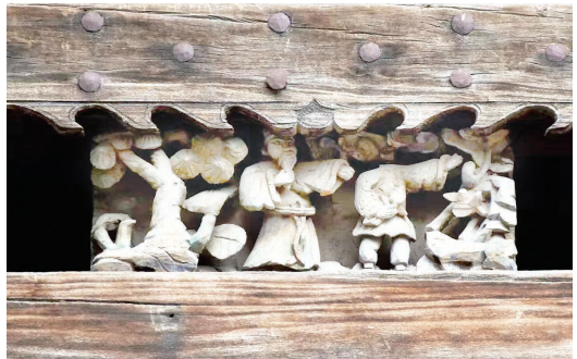
民居木雕