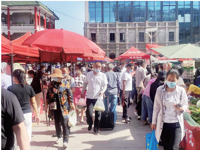
开化寺“钟点早市”熙熙攘攘的购物人群。

清晨6时,你会做什么?是精神抖擞地晨跑,还是烦躁地关掉闹钟?而这时的迎泽区开化寺“钟点早市”,却已经人来车往,一派“开市大吉”的气象。为了方便摊贩与市民之间的买卖,开化寺古玩市场利用空余区域,开辟了“钟点早市”,也成为我市规模较大的早市之一。这里有300多个摊位,既方便了商户和近郊农民进城卖菜,又丰富了市民的“菜篮子”。