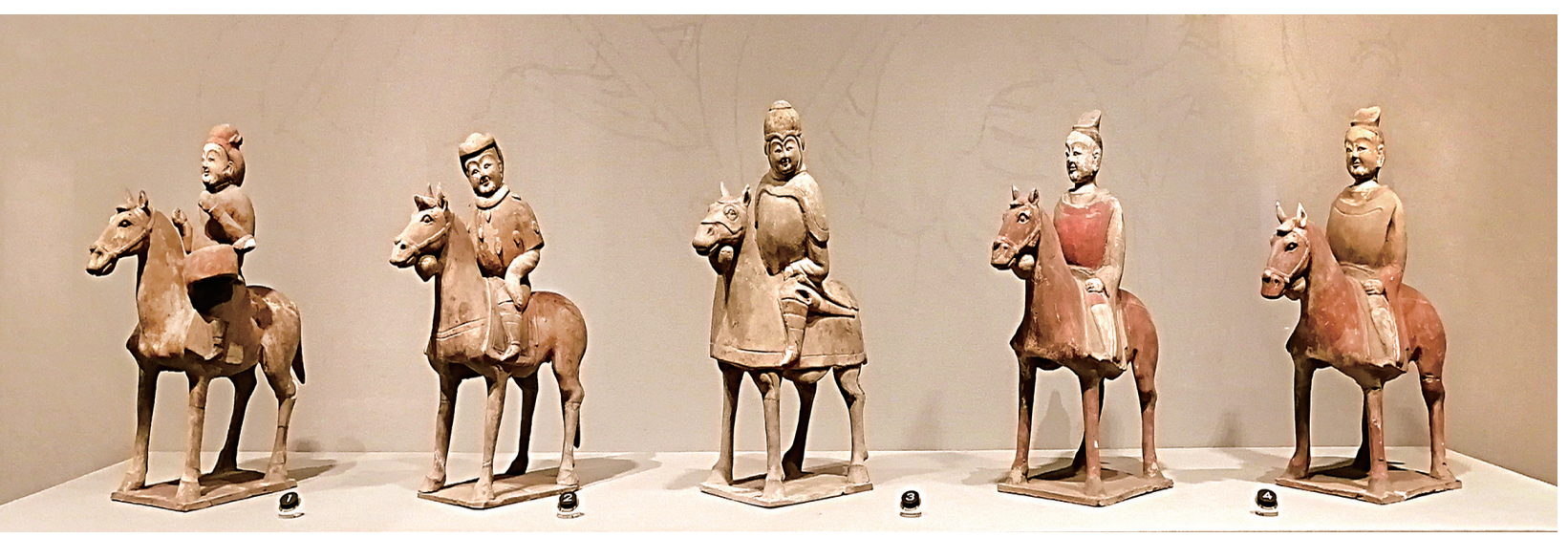
娄睿墓骑马俑(北齐)