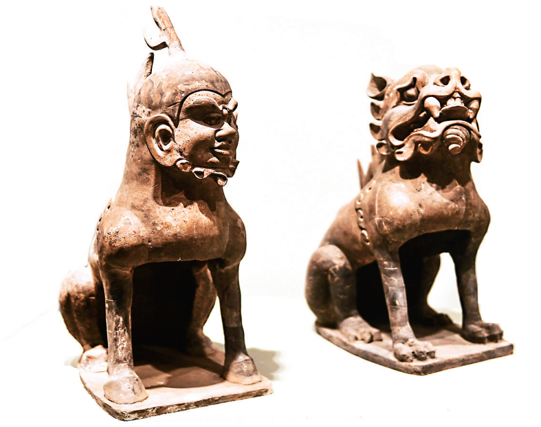
人面、兽面镇墓兽(北齐)