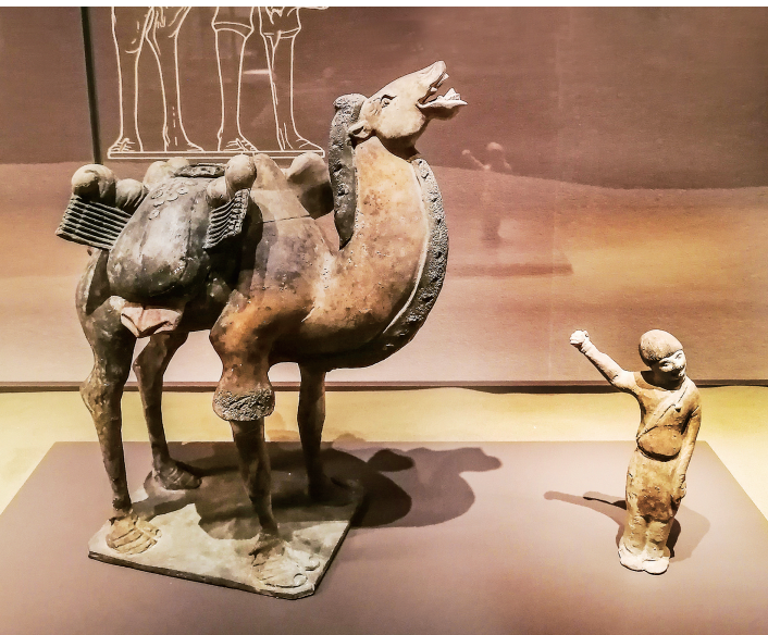
陶立驼·役夫俑(北齐)