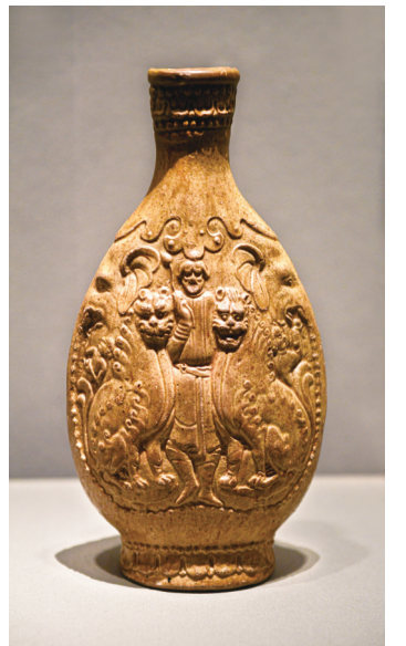
胡人双狮纹扁壶(北齐)