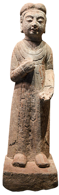
虞弘墓女侍俑(隋代)

虞弘墓里的胡人石俑、娄睿墓出土的人面镇墓兽、司马金龙墓的墓表……三晋大地上留下了民族融合的太多精彩。 构思巧妙的雁鱼铜灯、铁线勾勒的木板漆画、造型各异的人形铜镇……是历史的缩影，是文化的积淀和传承。 置身山西博物院“民族熔炉”展厅，如同站在游牧文化与农耕文化碰撞交往的旷野，观瞻一场民族融合的历史“大戏”。 “民族熔炉”展分“长城内外”“平城时代”“别都晋阳”“异域来风”四个单元，通过多个墓葬出土的铜器、陶器、石雕、木板彩绘等文物，讲述自汉末到隋代多民族文化聚合的进程。 “长城内外”讲述了山西成为北方各民族搏杀争雄中心的历史。 公元前后，匈奴人主宰了长城以北的蒙古高原。为阻其南下，西汉在雁北边关构筑屏障，重兵