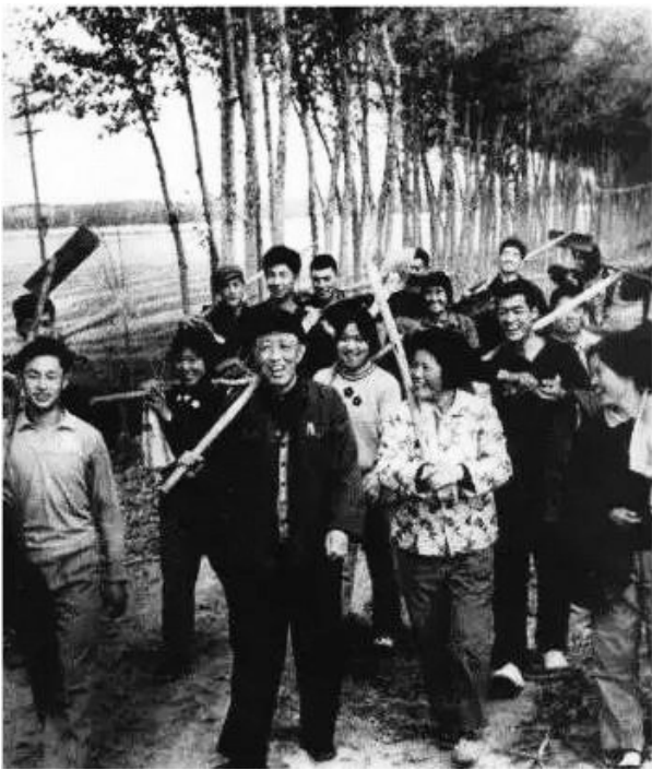
1980年，马烽在汾阳县与村民一起下地劳动。

我们小的时候，父亲有一次半开玩笑半感叹地对我们说：“你们将来别干写作这行。写不出来，吃不下饭，睡不着觉；写得兴奋了，还是吃不下饭，睡不着觉。总之就是吃不下饭，睡不着觉。”父亲写作有个特点，一旦构思基本完成，就拿出稿纸，估计好字数，数出张数，然后把平时攒下的、用过的牛皮纸信封拆开，给稿纸包个皮儿，用夹子夹好，像个稿纸本，这才开始动笔。写作中，但凡有改动的地方，他要横平竖直地画出框，把要删减的部分框起来，然后在框里画左斜线右斜线像网一样盖住，保持稿纸面的整体干净。父亲一旦投入创作，便全力以赴。1945年，他23岁，精力旺盛，和西戎合写《吕梁英雄传》长篇小说，不舍昼夜。2004年，他82岁，为《吕梁英雄传》电视连续剧剧本创作，不顾劝阻地投入修改，又一次“吃不下饭，睡不着觉”，而这次他竟然还忘记吃药，导致严重心衰，结果不治而终。纵观他的创作历程，从抗战时期写作《吕梁英雄传》，到合作化高潮时期创作出电影剧本《我们村里的年轻人》，这十多年是他创作的高峰期，不论是小说还是电影，都赢得了很高的评价。1978年，他56岁，重新开始写小说，到2004年去世时的82岁，这期间，有5年到中国作协任职，专事行政，没有动笔，其余时间，他下乡体验生活，伏案写作，写出了长、中、短篇小说16篇，与孙谦合作电影剧本8部，其中拍摄并上映4部，另有散文杂感计51万字。