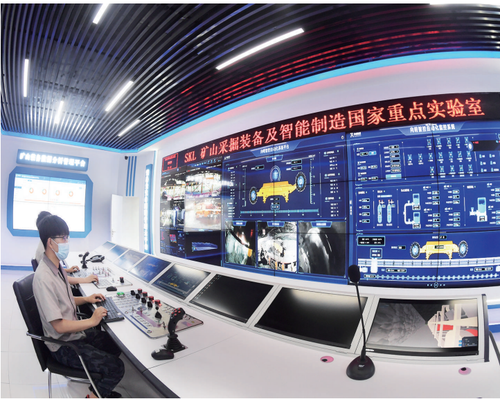
煤炭开采远程智能驱动控制系统