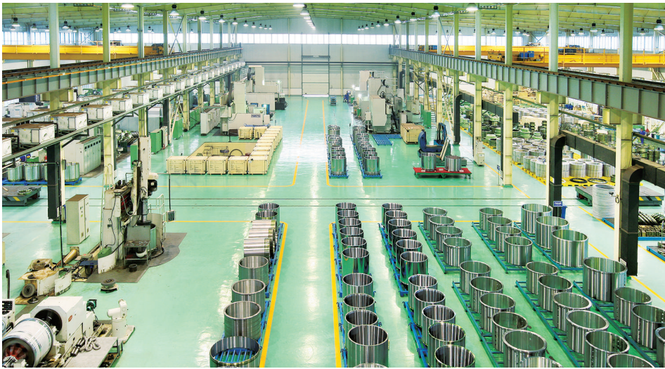
油膜轴承生产车间