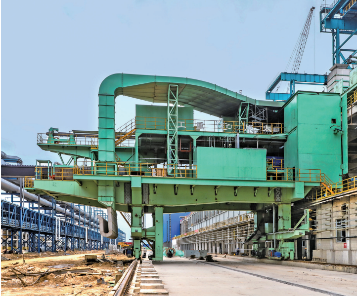
7.3米智能支护设备填补了我国大型支护设备绿色化、智能化的空白