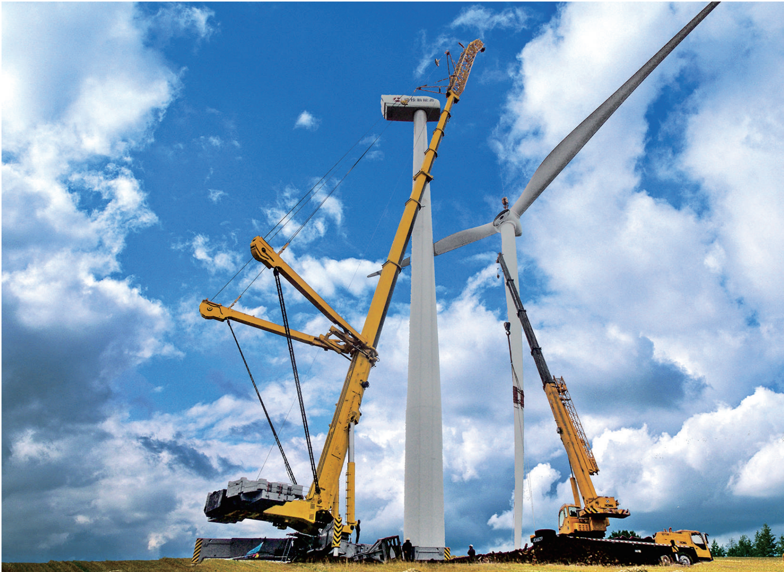
TZT1200履带式伸缩臂起重机吊装风电整机