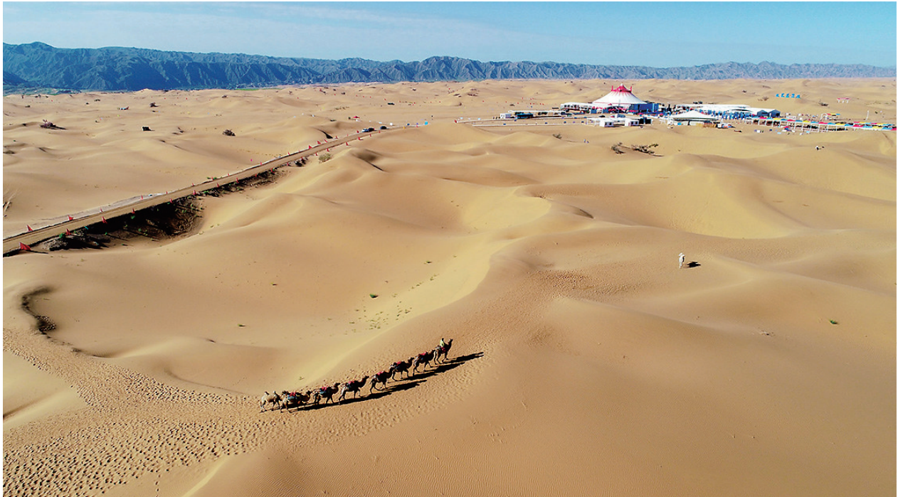
这是在宁夏中卫市拍摄的腾格里沙漠（无人机照片，2018年9月7日摄）。

“贺兰山下果园成，塞北江南旧有名。”夏日的贺兰山东麓，翠绿的葡萄园沿山势绵延南北，一眼望不到头。2020年6月9日，习近平总书记在银川市西夏区志辉源石酒庄葡萄种植地，远眺巍巍贺兰山，听取贺兰山生