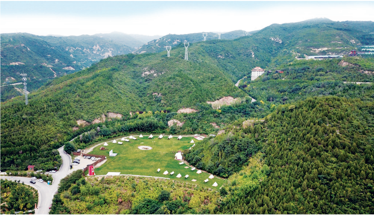
7月9日，五泉山城郊森林公园望旺谷休闲营地建设项目进入收尾阶段，白色的帐篷、红色的风车与绿色的草坪打造出亲近自然的露营地。