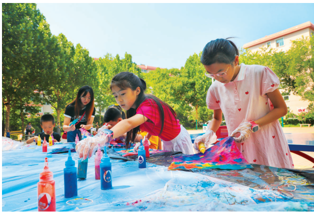
7月21日,长风西街道西岸社区开展“巧手扎染”实践课,丰富了孩子们的暑期生活。张昊宇 摄