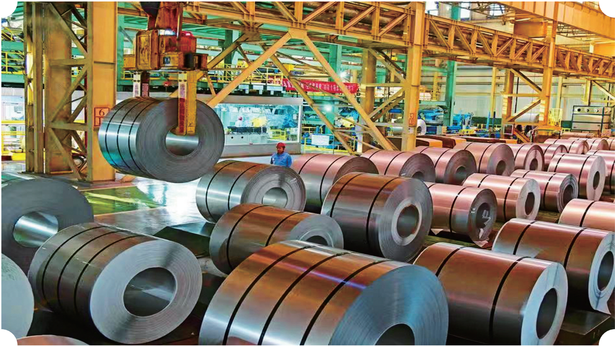
太钢手撕钢先进的生产线。

击、预期转弱的三重压力，全市上下一心，众志成城，按照党中央“疫情要防住、经济要稳住、发展要安全”的重大要求，以科学之策应对非常之事，以精准之措应对非常之难，在大战中践行初心，在大考中统筹兼顾，实现了疫情防控和经济社会发展的双战双胜。太原经济年中报出炉，一系列数据释放出“稳”的强音，透露出“进”的信号，用生动的笔触勾勒了太原在过去半年不平凡的发展历程。