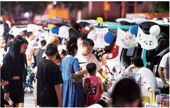
朝阳街上，后备厢经济火热。

农业特优发展显成效。随着都市现代农业的加快建设、设施农业全产业链的加快布局，农业特优发展之歌在希望的田野上奏响。上半年，全市实现农林牧渔业总产值35.94亿元，增长4.3%，农业实现稳产增产，为乡村振兴护航助力。果蔬长势更是喜人，全市蔬菜播种面积11.2万亩，增长1.9%，蔬菜及食用菌产量增长6.7%，园林水果采收面积2656.5亩，增长100.3%，产量增长37.3%。去农业园采摘、去美丽乡村旅游成为一种新风尚，农业的转型升级不仅让农民鼓了钱袋子，也为市民丰富了菜篮子，太原蹚出了一条现代都市型农业发展的新路子。 工业全面振兴多亮点。全市紧紧围绕强龙头、延链条、建集群，朝着“百千万亿”(万亿级工业产值规模、六条千亿级产业链、一批产值百亿级企业)发展目标，由市级领导挂帅，全面实行链长制，打造一批纵向关联、横向耦合、综合竞争力强的优势产业链，一大批工业好项目大项目建成投产达效，工业高质量发展的优势在集成、资源在集中、动力在集聚。速度加快、结构优化、创新加强，效益提升是上半年太原工业的亮点所在。上半年，全市规模以上工业增加值增长10.3%，连续两个月增速加快，重回两位数增长区间。前十大行业中8个行业实现增长，其中4个行业提速增长。工业产业结构持续优化，非传统产业增加值保持两位数增长态势，增长18.5%，增速高于传统产业增速14.6个百分点，对全市规模以上工业增加值增长的贡献率达到78.8%。新动能对工业经济发展的支撑作用不断增强，成为助推工业高质量发展的新引擎，高技术制造业增加值增长14.5%，工业战略性新兴产业增加值增长20.2%。惠企政策的助力之下，企业效益进一步好转，前5个月，全市规模以上工业企业利润99.5亿元，比上年同期增加7.9亿元。 服务业提质增效有力度。4月突发疫情对服务业造