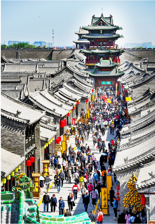
太原古县城游人如织，热闹非凡。

西山壁立，汾水流深。行至半山，舟至中流，所当乘者势也，不可失者时也，站在决定全年经济走势的关键节点，我们必须应变克难，实干为桨，牢牢把握有利条件，乘势而上，在全方位推动高质量发展中展现太原担当，全面再现“锦绣太原城”盛景，以优异成绩迎接党的二十大胜利召开！