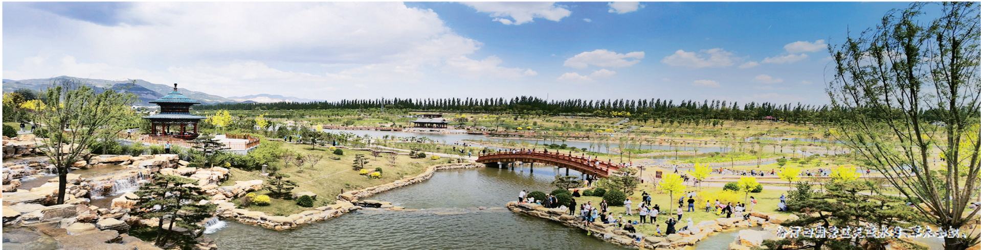
汾行四百里立见水清舟自平，晋人爱水。