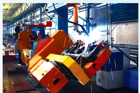
(本版图文由太原市工业和信息化局提供)