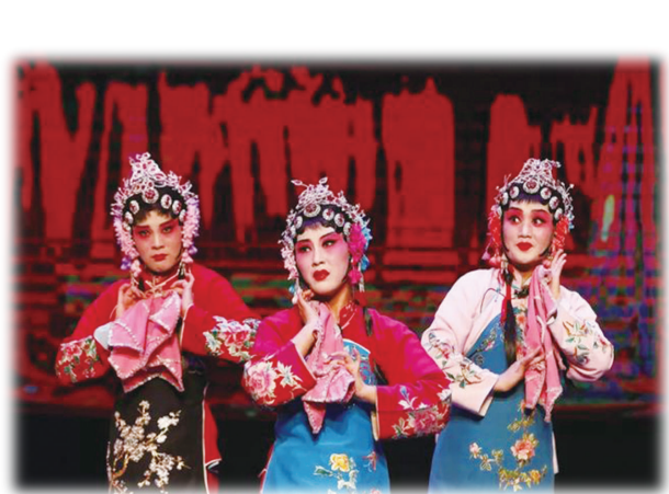
灵丘罗罗腔《小二姐做梦》剧照

传统剧目今存有《邯鄲会》《水牛阵》《伍子胥过江》《淤泥河》《苟家滩》《罗通扫北》《铁冠图》《三山岭》《描金柜》《金铃记》《三下阴》《吊煤山》《打鸟》《小二姐做梦》等40余部。其中《描金柜》和《小二姐做梦》最能代表灵丘罗罗腔的特色。在《小二姐做梦》中，主要演员可分别表演8个性别、年龄、身份、性格不同的人物，时而男，时而女，时而老，时而少，各尽其妙。