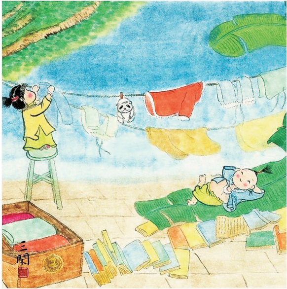
晒衣晒书 萧三闲 画

每年的暑伏天里，老太原有一件类似节日的热闹事，这就是“晒伏”：将雨季里吸足了潮气的被褥、棉袄及夹衣单衫，从箱子里翻出来，放到伏天火辣辣的太阳底下晒透。除了晒衣，还有晒书、晒经、晒旧、晒人。