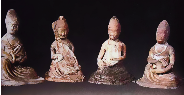
长治市区出土的唐代乐俑