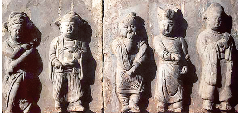
新绛县北马王村北宋墓杂剧砖雕