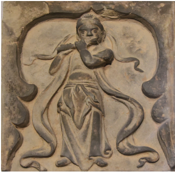
新绛县北苏村金墓髻髻砖雕