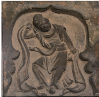
新绛县北苏村金墓髻髻砖雕