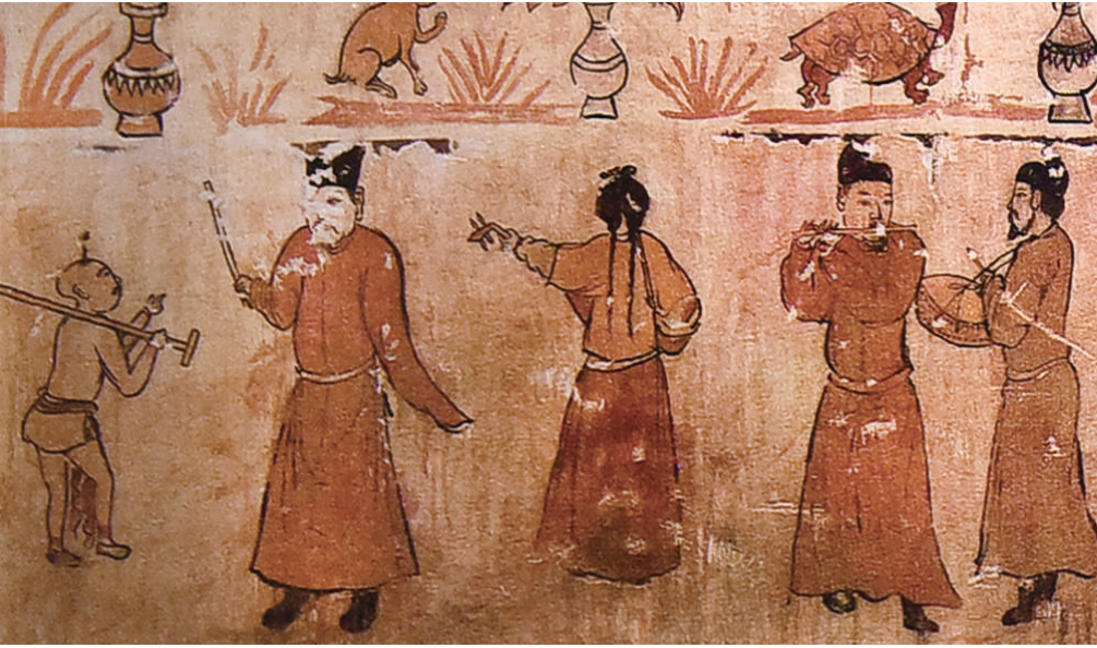
运城西里村元墓戏曲壁画