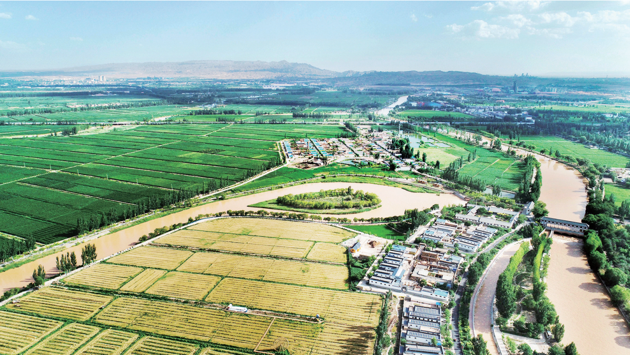
位于黄河分水口的宁夏青铜峡市大坝镇韦桥村(2022年7月5日摄,无人机照片)。

党的十八大以来，习近平总书记两次到宁夏考察，作出系列重要指示，要求宁夏“贯彻新发展理念，主动融入国家发展战略，进一步解放思想、真抓实干、奋力前进，努力实现经济繁荣、民族团结、环境优美、人民富裕”。 牢记习近平总书记殷殷嘱托，塞上儿女在黄河流域生态保护和高质量发展上争当表率，接续推进全面脱贫与乡村振兴战略有效衔接，以发展促团结，以团结聚人心，用自己的双手创造更加美好的新生活。