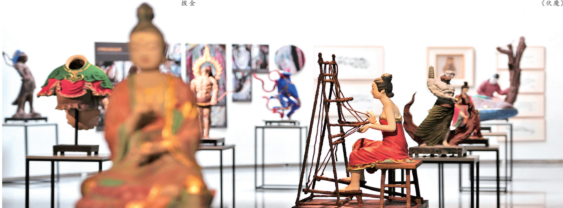
传统彩塑妆金(拔金)工艺的传承与创新人才培养项目实践成果展