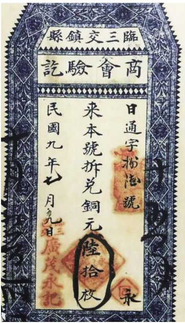
日升昌票号的汇票(日升昌票号博物馆藏)

几近完美的防伪手段，是没有出现冒领事件的基础，使得晋商票号经营上百年，信誉度极高，在中国金融业史上留下了辉煌的一笔。