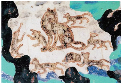
莫高窟第301窟的北周群虎图

北周时期营造的莫高窟第290窟窟顶东披，绘有一只正在哺乳的山羊。山羊静默站立，耐心为小羊哺乳。小羊跪在地上，正在仰头吮吸乳汁。古代画匠正是通过这样的画面，向人传达“母