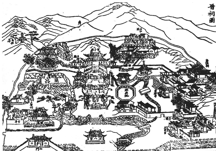
清雍正九年《太原县志》中的太原晋祠庙貌图

北宋初年，太宗赵光义灭北汉毁晋阳之后，大修晋祠。太平兴国九年(984)赵昌言撰写的《新修晋祠碑铭并序》曰：“……乃眷灵祠，旧制乃陋……况复前临池沼，泉源鉴澈于百寻；后拥危峰，山岫屏开于万仞”，又一次表明古晋祠所处的山水自然环境与现晋祠不同。不久后，太原地震，古悬瓮山崩塌，古晋祠被毁。据《宋会要》载，宋真宗大中祥符四年(1011)四月诏曰：“平晋县唐叔虞祠庙宇倾圮，池沼湮塞，彼方之人，春秋