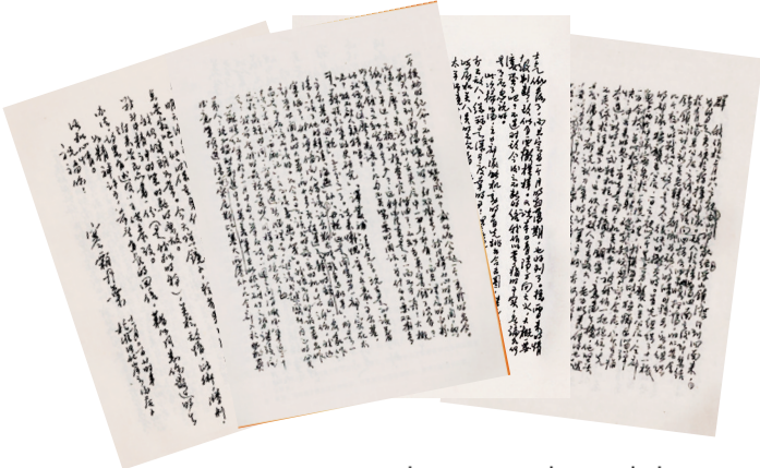
彭雪枫写给妻子的家书