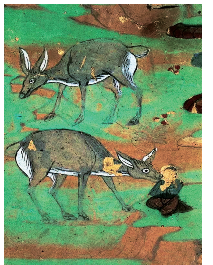
莫高窟第154窟的中唐鹿产女图

慈子孝”的观念——父母对子女的奉献和抚养是为本能，并未索求子女回报；但为人子女者，应像小羊一样，怀有跪乳之恩。