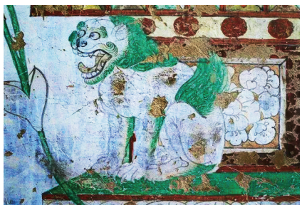
榆林窟第25窟的中唐狮子图