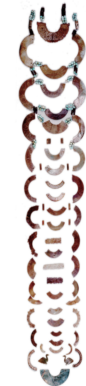
西周晋侯墓地玉组佩 (山西博物院藏)

历史虽然远去，而每当我们看到这套奢华的玉组佩时，仿佛又回到了那个环佩叮当、行走有度的时代，体会到悠久而灿烂的中国玉文化。