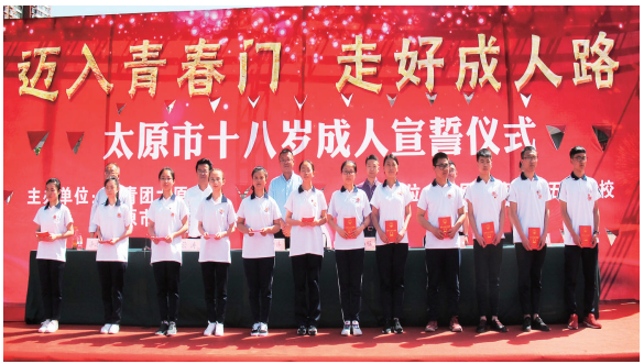
太原市十八岁成人宣誓仪式。

线上, 深入开展“青年大学习”行动。推进习近平新时代中国特色社会主义思想进支部、进团课、进社团、进网络。5年来, 共有150万余名青年学生通过在线学习, 了解世情、党情、国情、民情, 进一步坚定了“四个自信”。 线下, 引领广大青年学生积极投身到我军经济社会发展发展的火热实践。市直大中专院校组建理论普及宣讲团、党史学习教育团、乡村振兴促进团、发展成就观察团、爱心医疗服务团; 开展党史教育、红色宣讲、生态环保、文化惠民、社区服务、乡村振兴等社会实践活动; 先后开展“青春心向党 建功新时代”主题宣传教育实践活动160场次, 覆盖团员青年6万余名; 举办“青春心向党 建功新时代”太原市大中学生庆祝中华人民共和国成立70周年、纪念五四运动100周年爱国主义歌曲合唱展演; 举办“我和我的祖国”太原市大中学生校园歌手大赛等活动, 引导广大团员重温革命历史、传承红色基因, 增强听党话、跟党走的思想自觉和行动自觉。