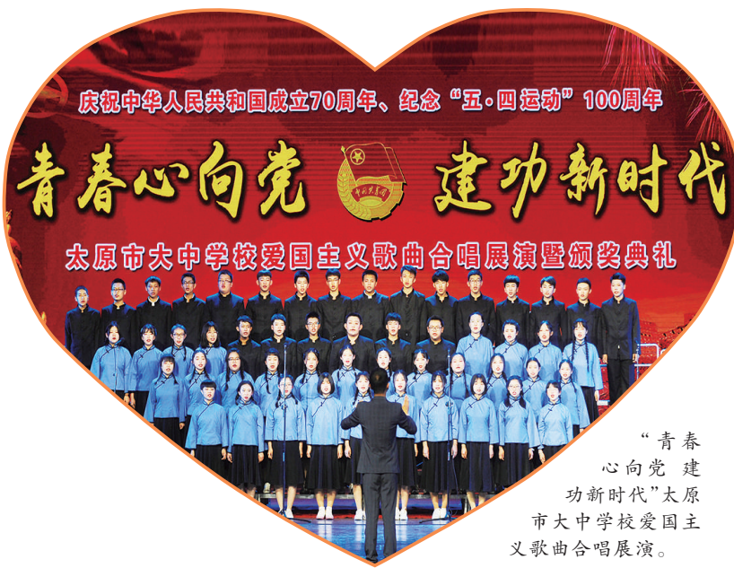
“青春心向党 建功新时代”太原市大中学校爱国主义歌曲合唱展演暨颁奖典礼。