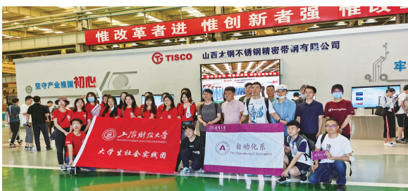
清华大学、北京大学、上海交通大学、上海财经大学学子来并开展社会实践活动。

为确保发展团员人人入系统、号号有保障, 共青团太原市委累计为25万余名团员建立电子数据库, 实现学校系统智慧团建“学社衔接”率99%、“升学衔接”率100%的高质量转接。 全市学校团组织以中学生团校规范化建设为突破口, 以“智慧团建”平台为依托, 以“团委工作手册”“团支部工作手册”“团员成长手册”“团校学员手册”为抓手, 进一步推进基层团组织建设工作规范化、制度化、科学化。