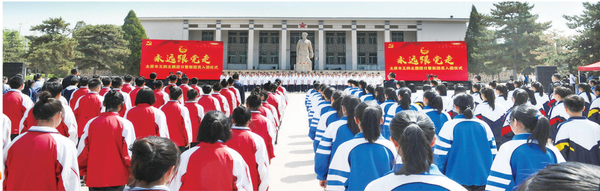
团员入团仪式集中示范活动。