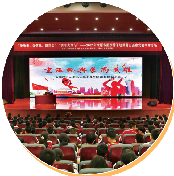
“学党史、强信念、跟党走”太原市团员青年培养营。