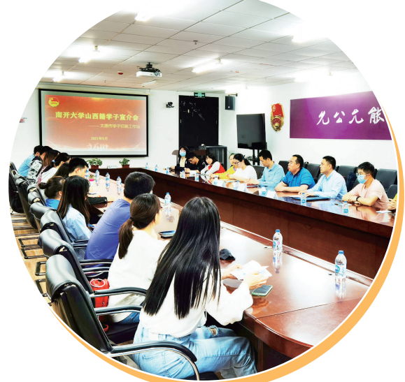
团市委赴南开大学开展晋籍学子宣介会。

牵到线上、帮到点上、暖在心上。为了解决在外学子信息不对称问题, 学子归巢工作站先后发布省、市级人才引进相关政策160份、太原城市宣传片3部、人才政策宣传片3部、各类就业招聘信息520条, 涉及岗位2.5万余个。同时收集学子就读学校、所学专业、就业意向等信息, 建立2800名优秀青年人才信息库, 纳入省、市级青年人才库, 向省、市有关部门推荐青年人才。依托山西青年人才驿站, 面向来晋创业就业的青年人才提供线上线下的综合服务, 为青年英才来并就业兴业牵线搭桥。 共青团太原市委积极开展“双一流”高校来并暑期社会实践活动, 组织联络清华大学、北京大学、上海交通大学等9所“双一流”高校的124名优秀大学生来并开展暑期岗位实习和社会实践活动, 为在外青年学子提供施展才华、历练成长、把论文写在祖国大地上的社会实践平台。 “我相信, 越来越多的山西籍优秀学子回乡工作, 势必会给太原这座城市带来更多的活力。”毕业于北京大