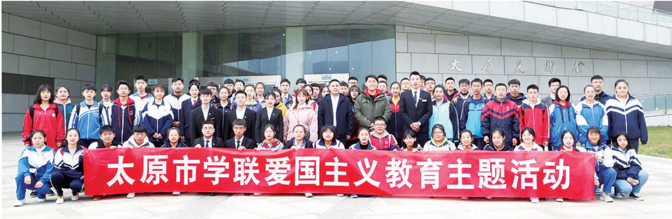
市学联爱国主义教育活动。