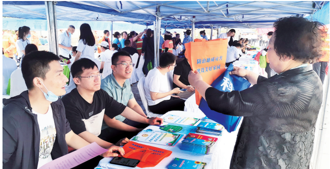
2021年全市安全咨询日活动。

为进一步发挥“青字号”品牌的广泛覆盖和示范带动作用，扎实推进团建工作与安全生产深度融合，规范青年安全生产示范岗管理模式，2020年底，共青团太原市委联合市应急管理局开展了太原市青年践行“人民至上、生命至上”理念，做到“十个确保”专题活动，先后在10县（市、区）及18个重点行业领域深入开展，通过广宣传、大排查、大比武、结对子、创经验、推做法、塑形象等方式，切实发挥青年职工在安全生产工作中的示范带动作用，推动安全生产宣传进企业、进农村、进社区、进学校、进家庭，持续引领全市广大青年职工扎实践行“人民至上、生命至上”理念，做到“十个确保”，真正让“安全”二字入脑入心。