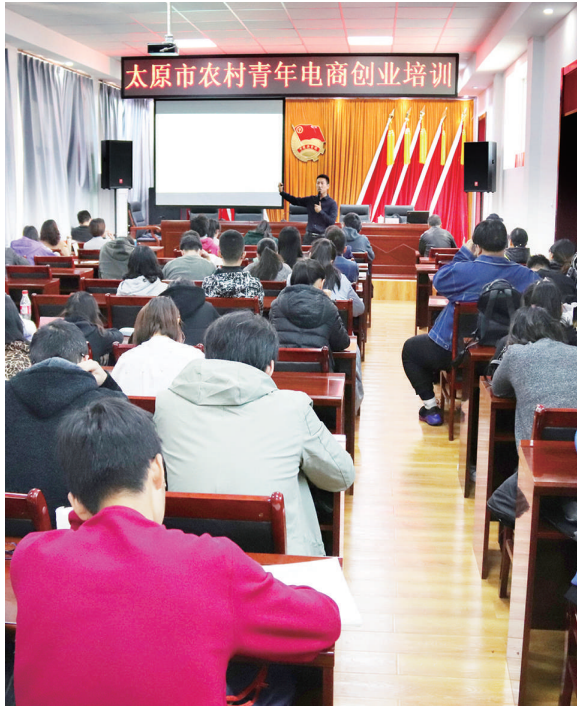
太原市农村青年电商创业培训。