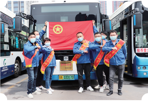
太原公交集团青年文明号。