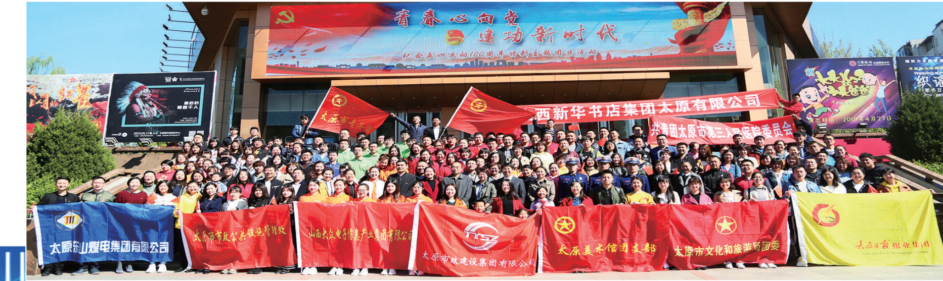
团市委开展“青春心向党 建功新时代”纪念五四运动100周年特别主题团日活动。

连续开展青年创新创业展示会。五年来，成功举办五届太原青年创新创业展示会，通过图文、多媒体、实物或模型等多种方式，生动展示我市近年来全面推进“大众创业、万众创新”中涌现出来的优秀代表和典型事迹，内容涵盖大众创业万众创新展示、“创青春”太原青年创新创业大赛成果展示、太原市人才政策、山西优秀科技工作者风采成果展、专家解读创新创业活动、创业融资现场咨询服务等，共计500余个“双创”成果集中亮相，50余家青年创新创业基地集体展示，数百位优秀科技人员集聚“论创”，营造了全社会关心支持青年创业的良好氛围。