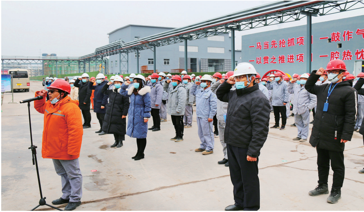
太原市青年落实“人民至上、生命至上”，做到“十个确保”传递活动宣誓仪式。

五年来，共青团太原市委紧紧围绕中心大局，聚焦凝聚、培养、服务等关键环节，统筹协调各类政策、项目、资源，助推青年成长成才，精心擦亮“青字号”品牌，为全面再现“锦绣太原城”盛景注入青春动能。