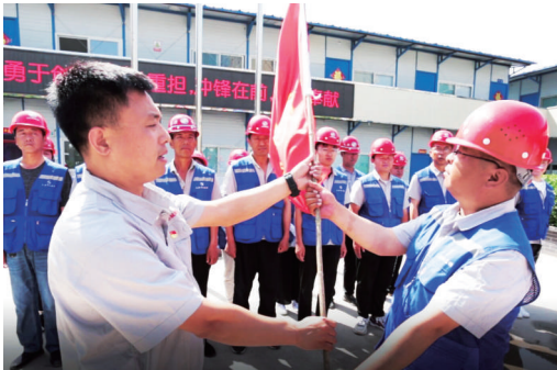
太原市政集团在千峰路南延建设工程开展“青年突击队”授旗仪式。

新冠肺炎疫情发生以来，太原市青发战线各团委发出倡议书，号召团员青年积极投身疫情防控，先后成立“青年突击队”302支、4700名团员青年冲锋在供电、通讯、医护等领域的最前沿，承担急难险重任务，为遏制疫情扩散、夺取防控战役胜利贡献青春力量，筑起防疫“青春长城”。