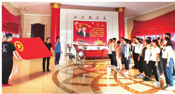
太原轨道交通集团“路寻红色足迹 团聚青春力量”主题团日活动。