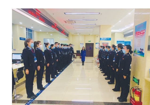
办税服务厅利用班后时间，邀请文明礼仪培训师开展文明礼仪模拟实训。

古交市税务局还组建局领导分别带队的入企纾困解难小组，开展入企服务解难题办实事。如：及时为山西煤炭运销集团古交世纪金鑫煤业有限公司办理1339.24万元留抵退税款，解决了该公司燃眉之急。组建由局领导带队的入企访谈团队，对新办户、留抵退税户、企业所得税退税户等纳税人进行“点对点”回访，听取纳税人感受及建议。付出终有回报，2022年，办税服务前阵地古交市税务局第一税务分局获得省级“巾帼文明岗”荣誉称号，留抵退税工作得到古交市委、市政府主要领导的批示肯定，包括山西西山华通水泥有限公司在内的广大企业对服务工作给予了一致好评。 杨 超