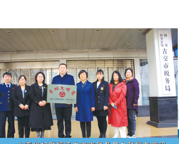
山西省妇联授予古交市税务局办税服务前阵地第一税务分局“巾帼文明岗”。