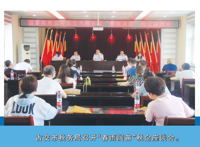
古交市税务局召开“春雨润苗”税企座谈会。