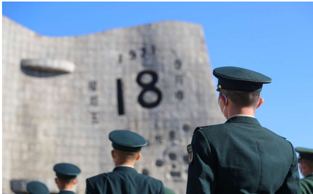
今年是九一八事变爆发91周年。9月18日上午，勿忘九一八撞钟鸣警仪式在沈阳“九一八”历史博物馆铭历史碑广场举行。