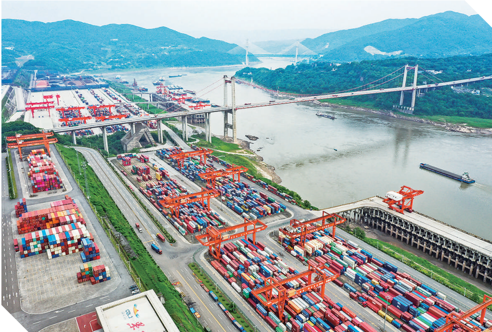
这是重庆果园港一带景象(2022年5月24日报,无人机照片)。