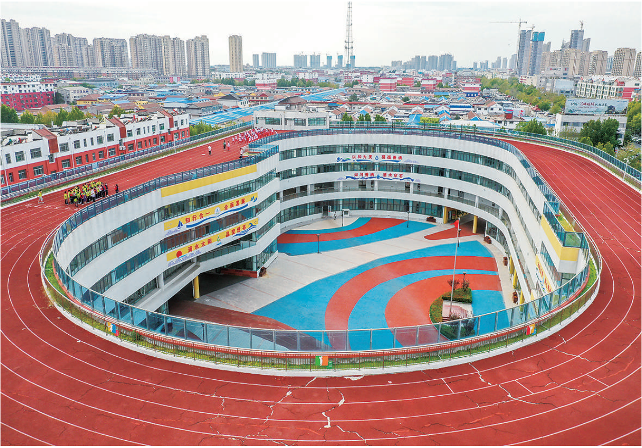
这是9月20日拍摄的齐河县第六小学(无人机照片)。这所地处闹市的学校将地下停车、地上教学、运动场地分层穿插布局巧妙融合,节地率达到54%。