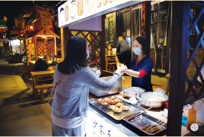
图①:游客在城内参观。 图②:演员在城内进行民俗表演。 图③:演员在主题音乐节上表演。 图④:游客在城内露营。 图⑤:游客在城内购买小吃。(图片均为9月30日摄)