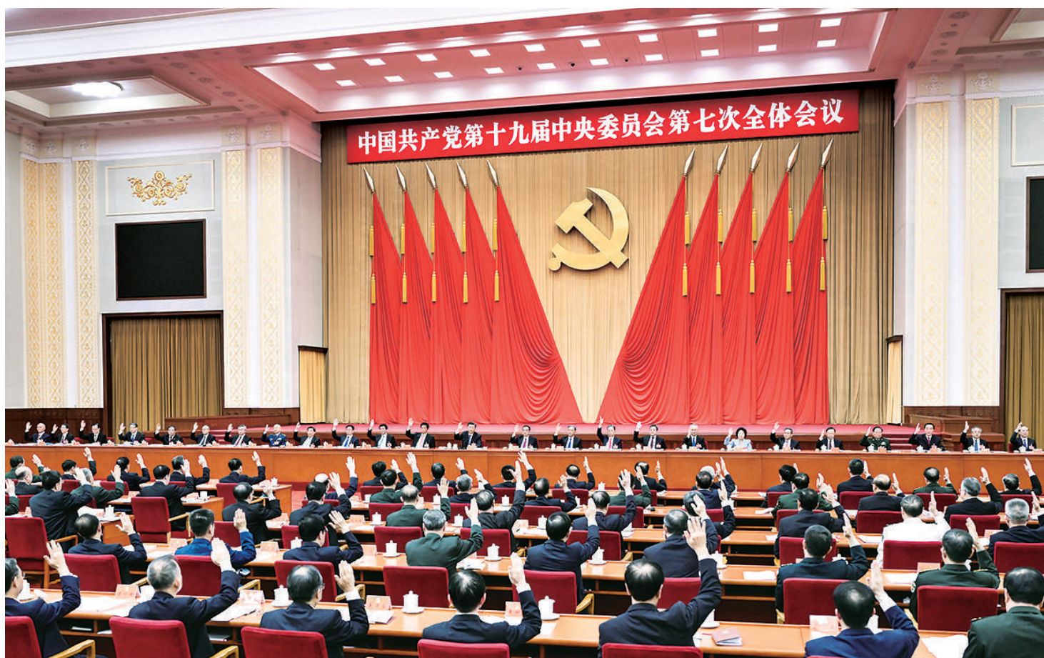
中国共产党第十九届中央委员会第七次全体会议,于2022年10月9日至12日在北京举行。中央政治局主持会议。