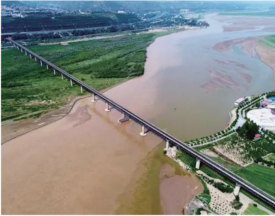
1970年建成的黄河风陵渡铁路桥

蟠龙寨有西、南两座城楼,互为犄角。西门城楼建于一陡坡之上,下面开阔沟地为百果园,易守难攻。南门城楼建于东南角,坐北朝南,筑有厚重夯土城墙,东墙下有藏兵洞。听村民说,他记得小时候常在南城楼下的暗河里耍,南门城楼前有瓮城,三面临崖,形成一道天然屏障。