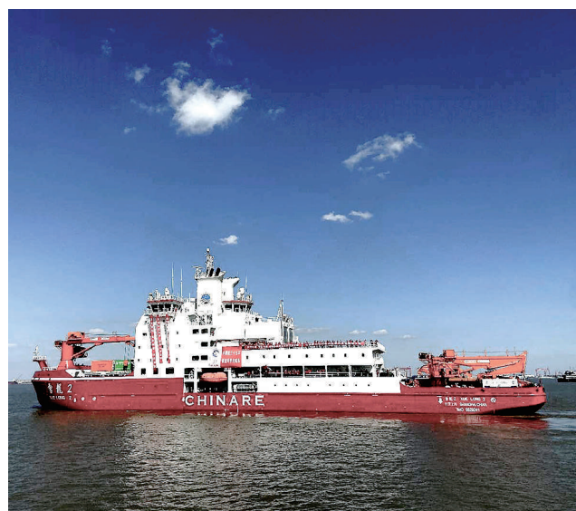
2020年11月10日，中国第37次南极科学考察队乘坐“雪龙2”号极地科考破冰船从上海起航，奔赴南极执行科学考察任务。

新华社记者 韩洁 徐扬 樊曦 谢希瑶 高敬 叶昊鸣 (新华社北京10月19日电)