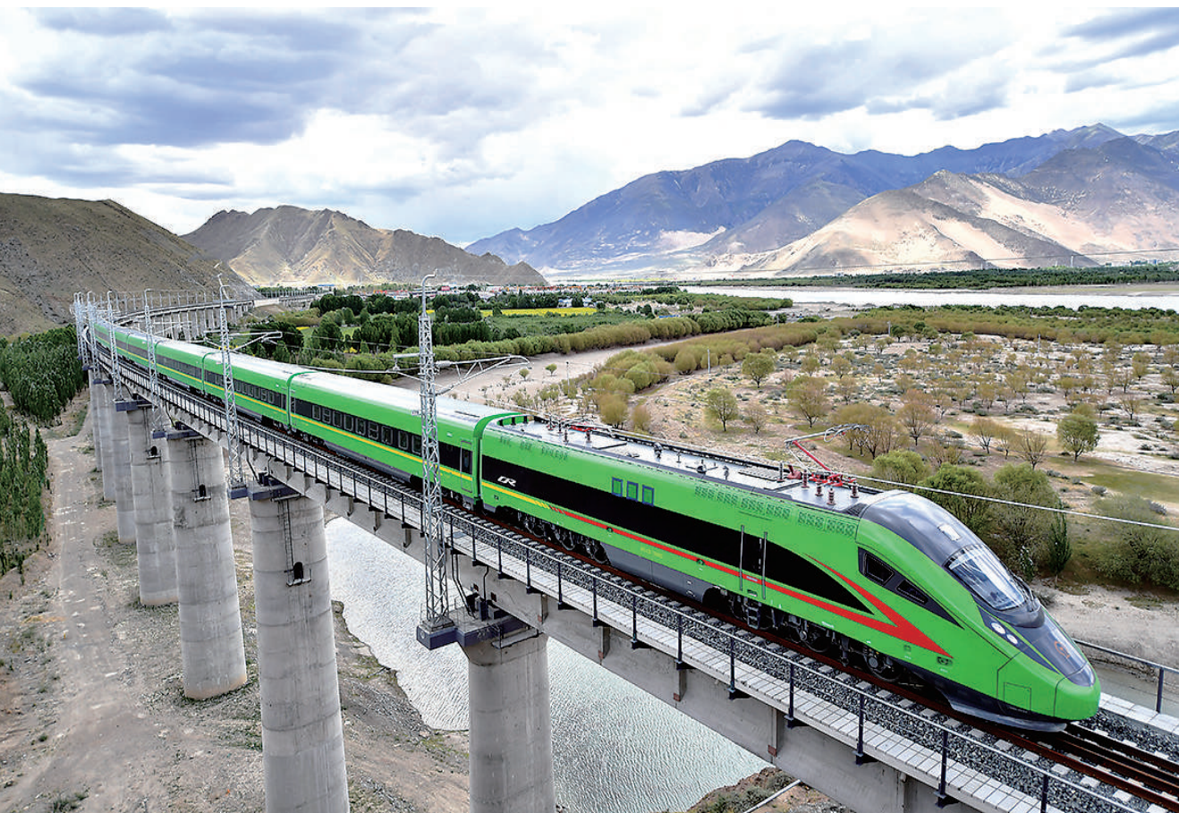
2021年6月25日，全长435公里、设计时速160公里的拉林铁路建成通车，西藏首条电气化铁路建成，同时复兴号实现对31个省区市全覆盖。这是试运行中的复兴号列车行驶在西藏山南市境内(2021年6月16日摄)。