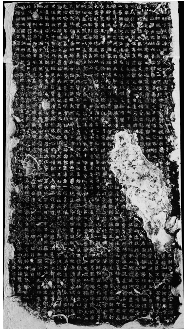
曹恪碑(山西古建筑博物馆藏)拓片

曹恪碑是南北朝时谯郡太守曹恪的墓碑。碑文对曹氏世裔叙述极详，对曹恪本人的生平及业绩都作了明确记述。曹恪，沛国谯人(今安徽亳州一带)，生于南朝宋元嘉二十四年(447)，卒于西魏大统十年(544)，享年97岁，系西汉丞相曹参后裔，属名门望族之后、世家之家。他20岁便已成名，读书，熟战策，勇略过人，被授予绥远将军、屡立战功。他为人孝德俱全，行为端庄，忠厚老实，轻财若水，重义如山。西魏大统初年(535)，旨授本土谯郡太守。大统十年，忽遭疾病，一病不起，逝于安邑，安葬于鸣条岗南垣。 曹恪碑是中国书法史上魏碑的代表，它上承汉隶传统，下启唐楷新风。