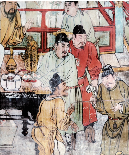
水神庙元代壁画《渔翁卖鱼图》

传世哥窑瓷细致、精美，具有独特的艺术魅力，对后世影响深远，一直被视作名瓷而进行仿烧。明宣德年间已成功仿烧哥窑瓷，清雅正、乾隆时期达到兴盛，着重仿釉色和开片装饰，造型既有常见的哥窑瓷式样，也有当时流行的各种式样，如笔山、水丞、象棋等文房用品，以及花瓶、葫芦瓶、杏圆瓶、琮式器等陈设器。