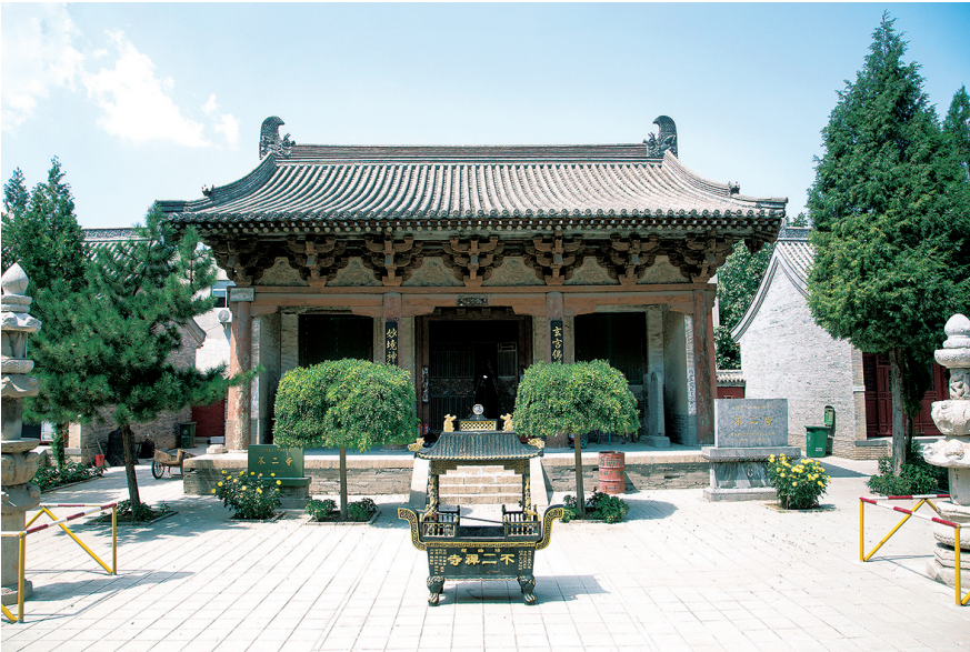
不二寺大雄宝殿