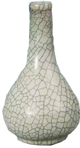
哥窑灰青釉胆式瓶(故宫博物院藏)