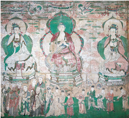
不二寺明代壁画

太原市阳曲县首邑西路旁的一条小巷里，有一个国保单位——金代遗存不二寺，其独特的建筑和精美的壁画、彩塑，具有浓厚的文化和艺术魅力。 不二寺是迁移而来的，原址在阳曲县黄寨镇小直峪村，1985年文物普查时大殿殿破不堪，并处于庄稼的包围之中，距大殿东面3米处是深约百余米的沟壑。鉴于该殿各种条件限制，在原地保护困难极大，经山西省文物局和太原市人民政府批准，1987年至1989年，将大殿整体搬迁至现址。2006年5月，国务院公布其为第六批全国重点文物保护单位。