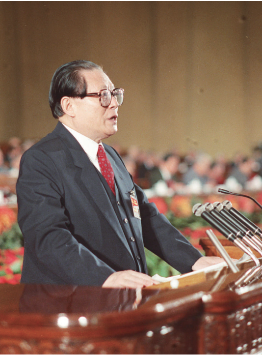
左图:1992年10月12日,中国共产党第十四次全国代表大会在北京人民大会堂开幕。这是江泽民同志代表第十三届中央委员会作报告。