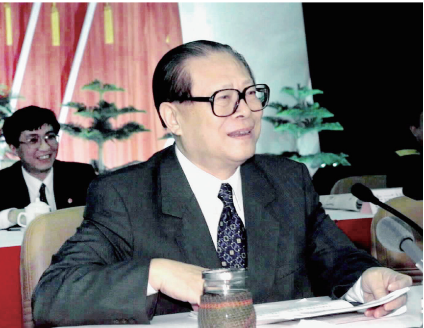
上图:2000年2月20日,江泽民同志在广东省高州市领导干部“三讲”教育会议上发表重要讲话。在这次广东考察中,江泽民同志提出,我们党总是代表中国先进生产力的发展要求,代表着中国先进文化的前进方向,代表着中国最广大人民的根本利益。