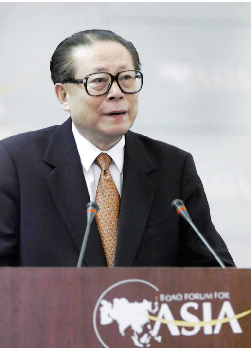
上图:2001年2月27日,博鳌亚洲论坛成立大会在海南举行。江泽民同志出席成立大会并致辞。