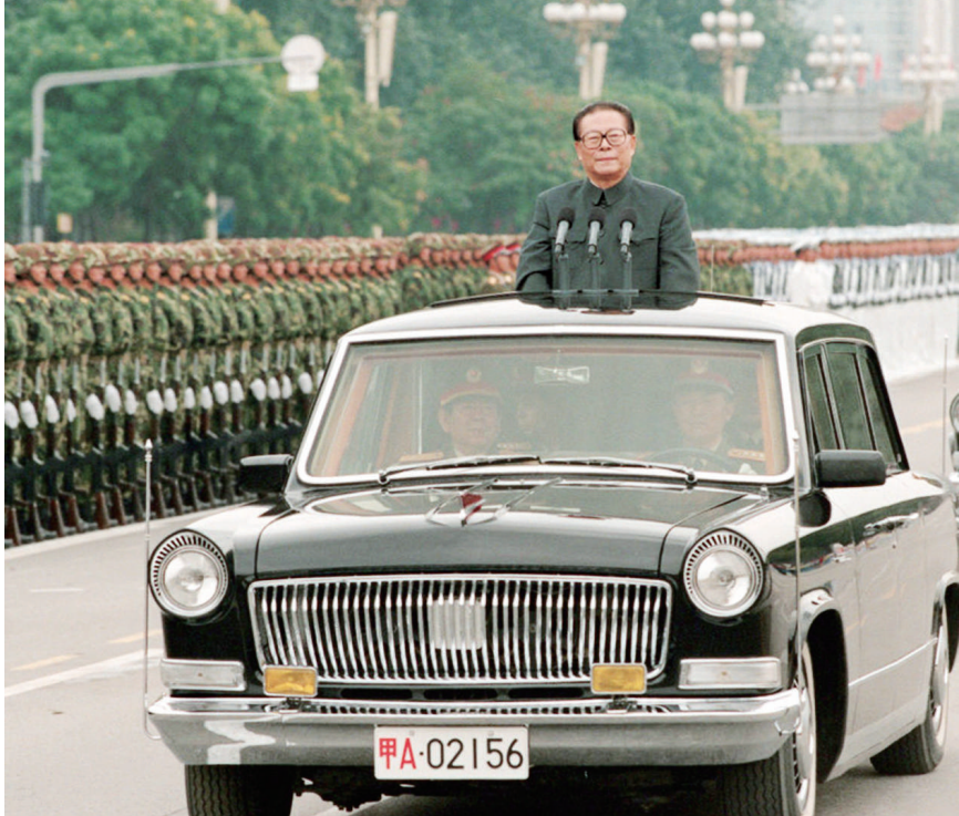
左图:一九九九年十月一日,中华人民共和国成立五十周年盛大庆典在北京天安门广场举行。江泽民同志检阅由人民解放军陆军、海军、空军和武警部队组成的地面方阵。