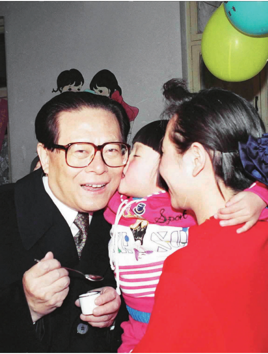
右图:1993年12月5日,江泽民同志在北京为一位幼儿园儿童喂服脊髓灰质炎疫苗后,小朋友亲吻江爷爷。