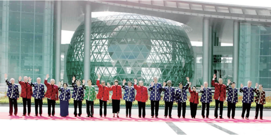
左图:2001年10月21日,亚太经合组织第九次领导人非正式会议在上海举行。这是江泽民同志与参会的经济体领导人合影。