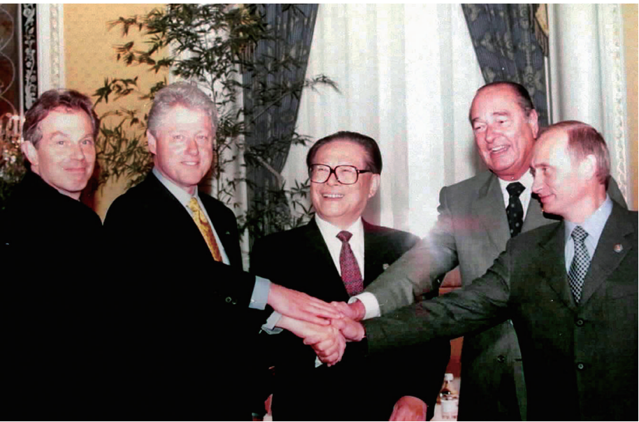
左图:2000年9月7日,由联合国安理会五个常任理事国首脑会议在纽约举行。江泽民同志(中)同法国总统希拉克(右二)、俄罗斯总统普京(右一)、英国首相布莱尔(左一)、美国总统克林顿(左二)握手合影。