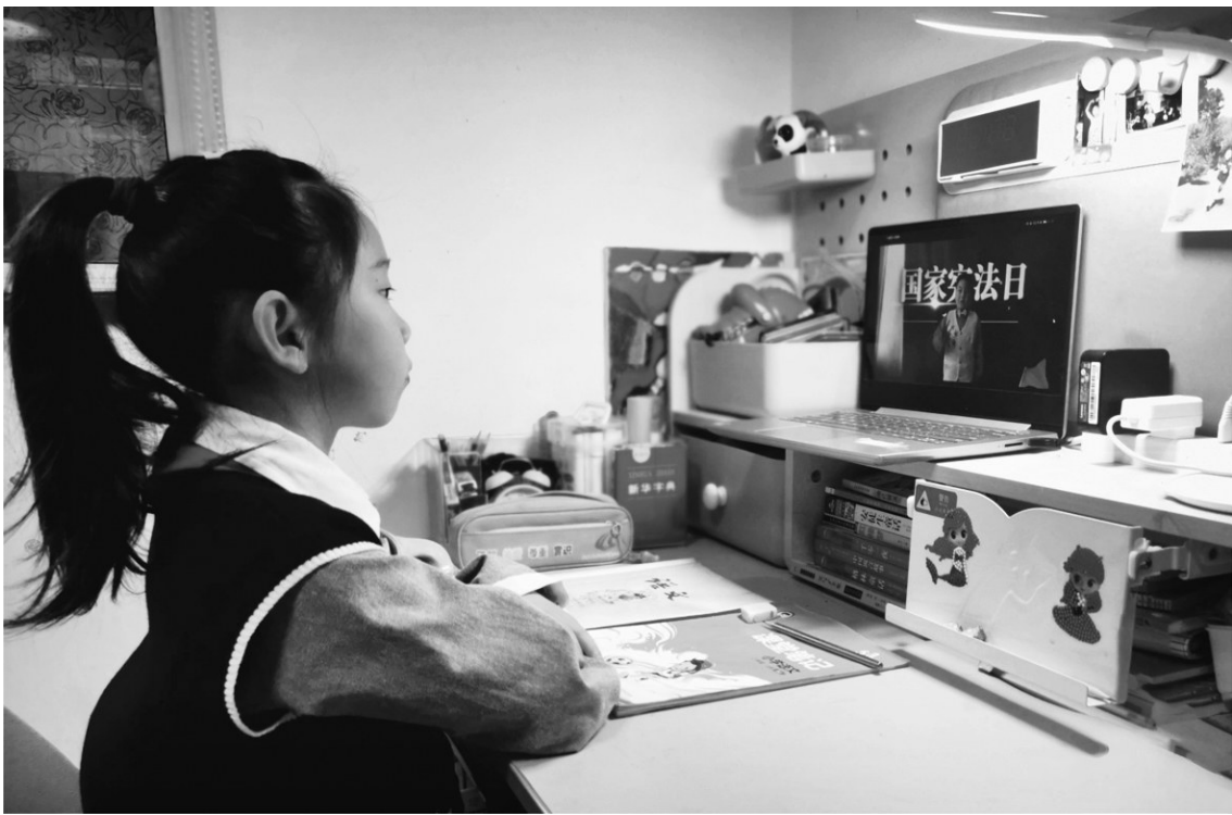
十二月四日是第九个国家宪法日,迎泽区双西小学开展了“学法增知识”主题活动。学生们通过视频展示的方式,学习宪法知识,增强遵纪守法的意识。