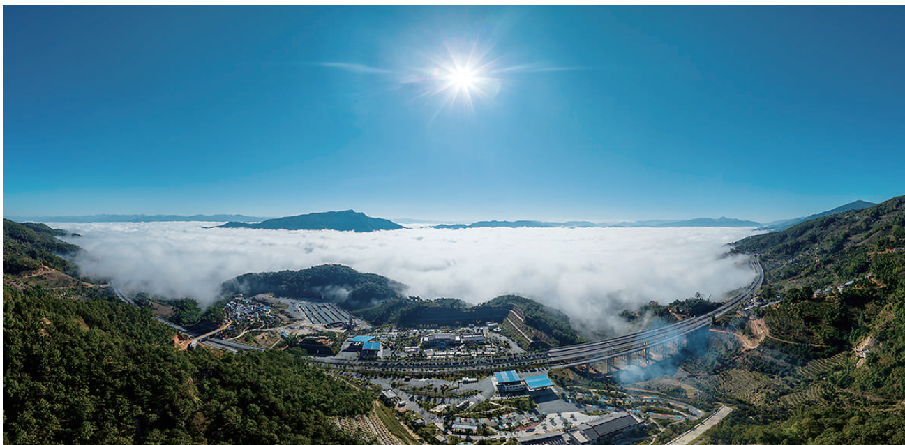
这是在云南省临沧市临翔区马台乡拍摄的云海景观(12月10日,无人机全景照片)。在云南省临沧市,晴朗的冬日是欣赏云海的好时节。登山巅俯瞰,云雾在山谷间如海水般波起峰涌,蔚为壮观。

该特别专题主编、上海交通大学景益鹏院士表示,“高灵敏度FAST观测揭示了银河系前所未有的细节。研究团队发表的中性氢和电离氢数据库可以用于探索银河系星际气体的许多特征,为世界范围内的天文学家提供了宝贵的数据资源。”